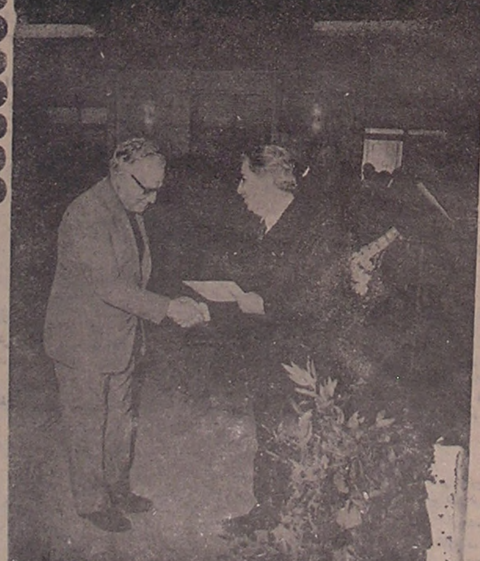
این عکس مراسم دریافت احکام طرح طبقه بندی کارگران برق منطقه خراسان را که دو هفته گذشته انجام گرفت نشان میدهد

کارگران فنی و ساده با پشت کار همیشه می توانند برای خودشان ثروت و سعادت فراهم کنند و برای اجتماع و مین خود نیز مفید باشند اگر بخاطر آن باشد در ایام گذشته هنوز تمدن جدید صنعتی اینقدر وسعت نیافته بود و جابجایی اختراع و پیشرفت وجود داشت ولی امروز همه چیز را اختراع کرده اند و جا برای پیشرفت وجود ندارد کسی که چنین فکر کند اساسا اختراع را نفهمیده است اولا هر قدر علم و صنعت پیشرفت کند بهمان اندازه احتیاج برای اختراعات جدید بیشتر می شود و ثابا اختراع همیشه عبارت از چیزی است که اساس یک صنعت یا زندگی یک اجتماع را تغییر داده بلکه اختراعات واقعی عبارت از پیدا کردن وسایل کوچک و بی اهمیت برای انسان کار و زندگی چهارخانه و چند کارخانه میباشد در جواب خواننده عزیز نمی خواهم شرح حال یکی دیگر از کارگران ساده را در قریب این گذشته بنویسم ولی اتفاقا مطلبی بدست افتاد که درست مشکل مع و شما را حل میکند در این مطلب شرح حال دو نفر کارگر ساده را نوشته بودند که اتفاقا یکی از آنها ایرانی است و این نوشته در اثر فکر کوچک اکنون میبازر شده اند و شرح حال آنها این خاصیت را دارد که در دوره خود است و چند سال قبل هر دو شریک به امروز یک کارخانه بزرگ را اداره می کنند و مزه بیکر بودند و بعنوان مسکانشین هوا پوما در فروگاهی کار میکنند شرح حال این دو نفر دوست برای کارگران فنی و خوانندگان ارجمند باید بسیار جالب و مسر مقل خوبی باشد و من اینک آن را برای شما نقل میکنم: هائری فوره که خودش یکی از کارگران ساده بود و در اختراعات خود بزرگترین ثروت مند و کارخانه دار قوی معاصر شد روزی سهفته او با چوچه آزمایگاه جدید و علم و وسایل فنی و کارخانه های بزرگ و ثروت و سعادت در انتظارش