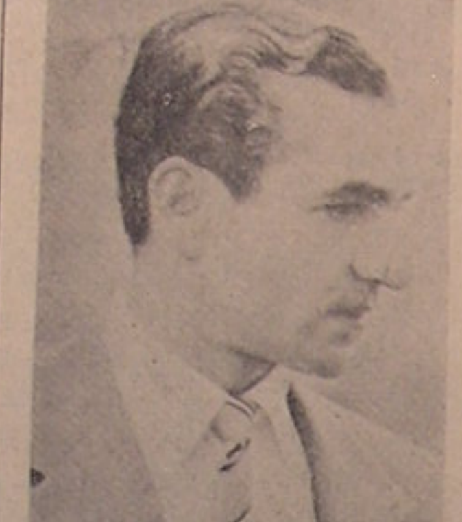
پاسخ شاهنشاهی به سؤال مربوط به صدور فرمان انتخابات

این دستور هر چه زودتر صادر خواهد شد و بعد نیست که پس از انجام عملیات هیئتی که مأمور رسیدگی و اظهار نظر در قوانین موجود است بانی است قبل از آن که همین ماه این فرمان صادر گردد. بقیه در صفحه ۲