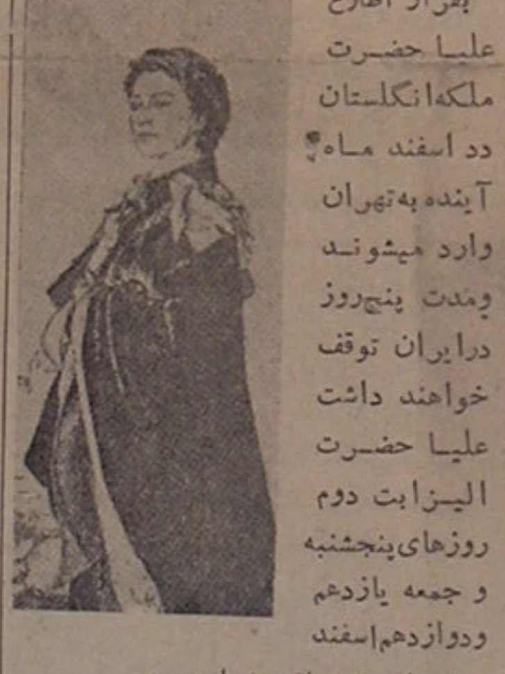
بقلم: ش. م. رهنما

به ایران بقرار اطلاع علیا حضرت ملکه انگلستان ۲۲ اسفند ماه آینده به تهران وارد میشوند و مدت پنج روز در ایران توقف خواهند داشت علیا حضرت الیزابت دوم روزهای پنجشنبه و جمعه یازدهم و دوازدهم اسفند در تهران پذیرائی خواهند شد.