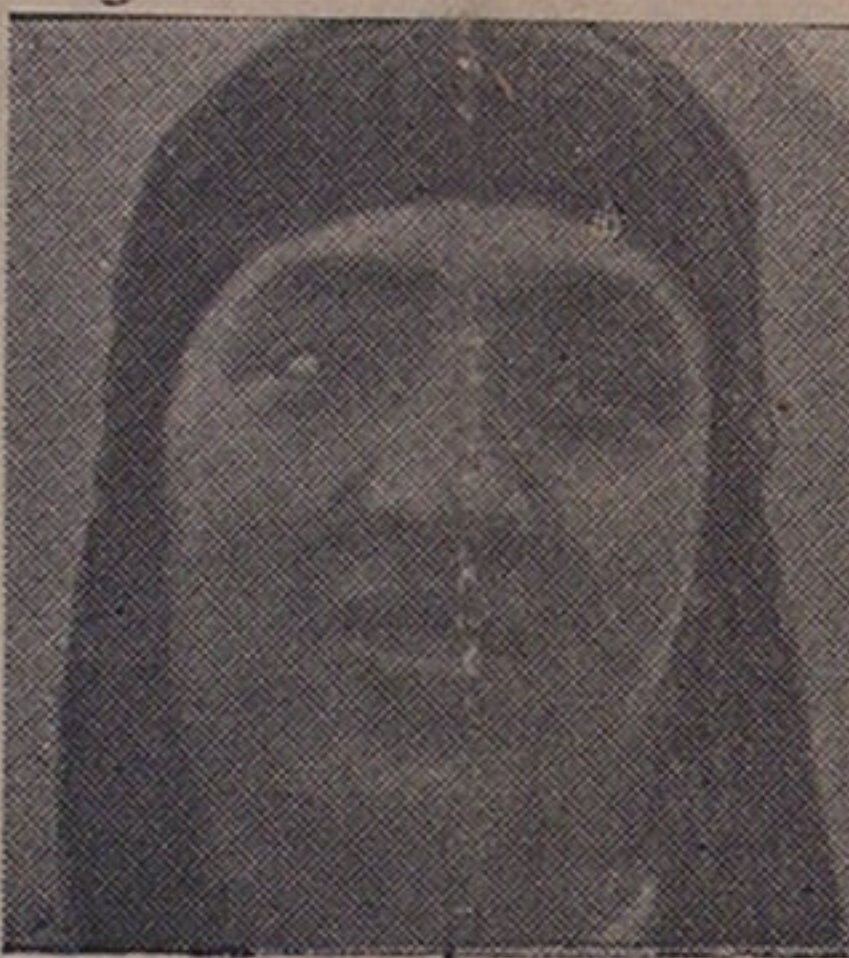
درا نظرار نتیجه تحولات اخیر ممالک عربی