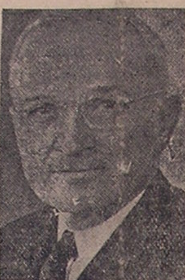
عقیده اینان شوروی برای جنگ آماده میشود.