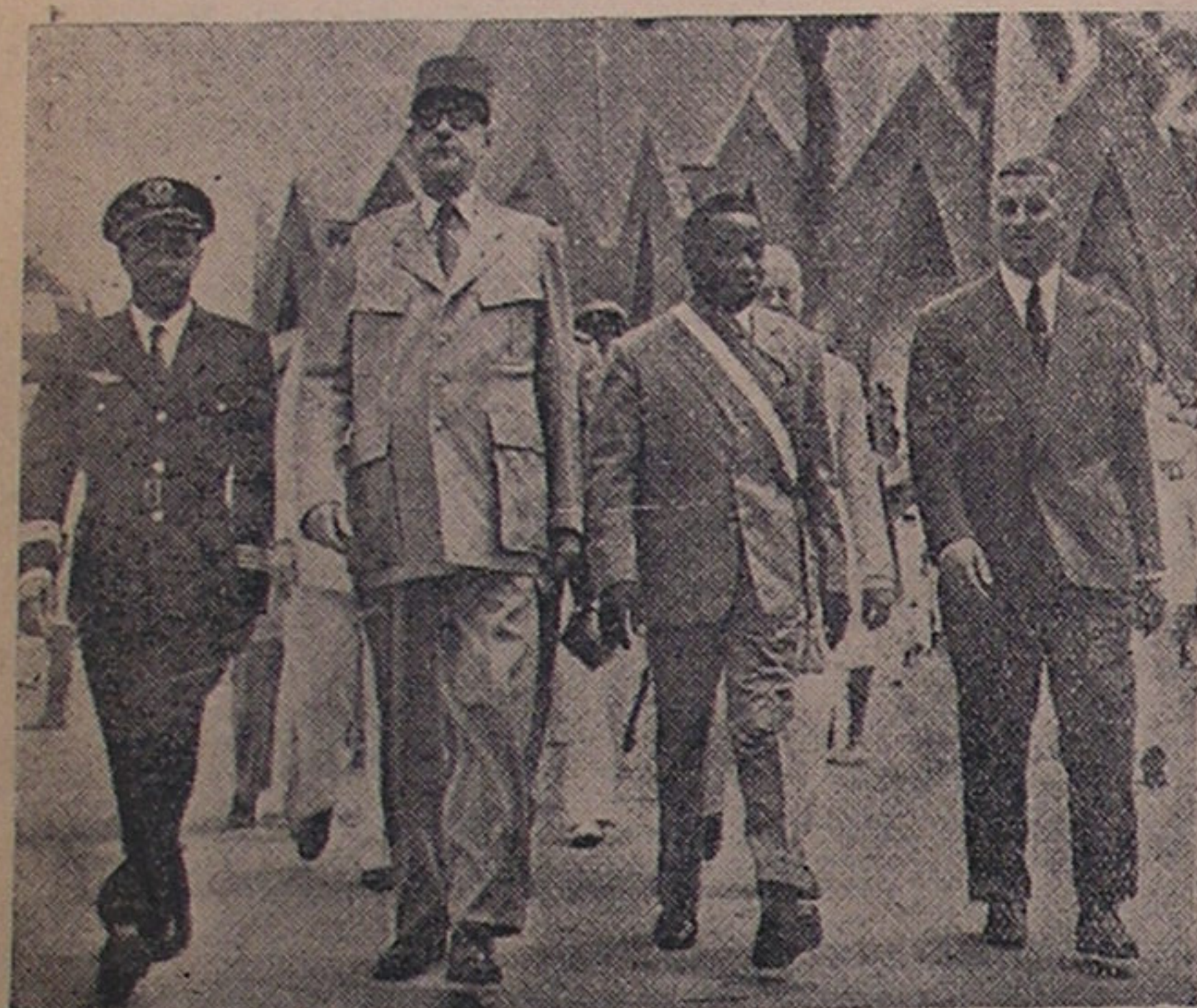
دو گل با رهبران افریقا در برازیل که از او استقلال میخواستند

(ما آزادی را با فقر ترجیح میدهیم ببردگی با ثروت)