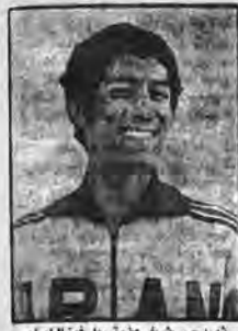
شهید حبیب شریفی طوطی‌پهلوی فوتبال ایران

زمانی که قهرمان هر خط از بازیگر بود، این خط هرات از حد هفتاد تن در فریب زمین و از راه هوا می‌پاشید که دست برده از شهر را می‌کشد و بکشد و قهرمان دیگر بر جای می‌ماند.