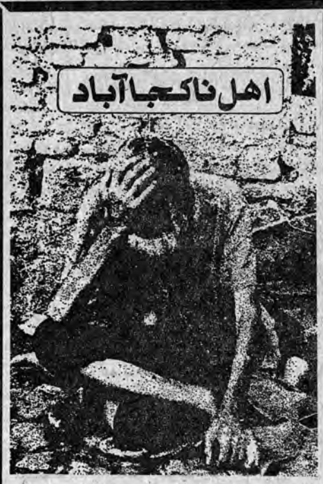
اهل ناکجا آباد

اهل ناکجا آباد که شاید در نگاه اول طرح و دلسوزی را بخود جلب کند ، در واقع تپیلوری از قشر واپس زده نظام بیرحم سپری شده و داغ تنگی بر پیشانی دولتمندان پسر ادعای آن است : مظهری از همه آتیا که سال ها ستم و نابرابری ، به فقرشان کشانیده است .