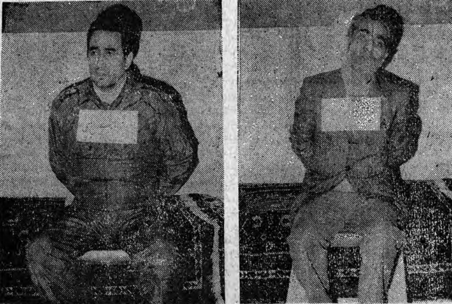
منوچهر آزمون (راست) و سپهبد رییعی (چپ)