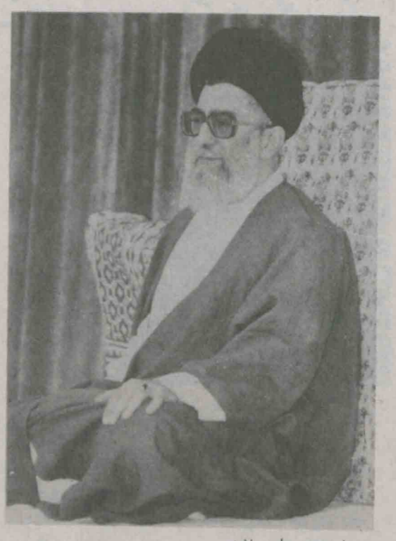
بم نام الله الرحمن الرحیم یا مقرب اللطوب والابصار یا مدبر اللیل والنهار یا معلول الاحوال والاحوال حول حالنا الی احسن الحال عید سعید نوروز را به همه ملت عزیز ایران و ایرانیان که در سراسر جهان زندگی می کنند و به ملتای فارسی زبان مانند ملت افغانستان و تاجیکستان و همچنین به ملتای که عید نوروز را بزرگ می شمارند و گرامی می دارند، تبریک عرض می کنم. بدین ترتیب، عید نوروز وسیله ای برای احساس همبستگی ملتای متعددی است که امیدواریم این همبستگی روز به روز میان ملتای برادر و همسایه و مومن بیشتر شود.

بخش خوبی: حضرت آیت الله خامنه ای رهبر معظم انقلاب اسلامی به مناسبت حلول سال نو طی پیامی، سرفروشت کشور را نیز به بهترین وجه برگزار کنند. متن کامل سخنان رهبر معظم انقلاب بدین شرح است: