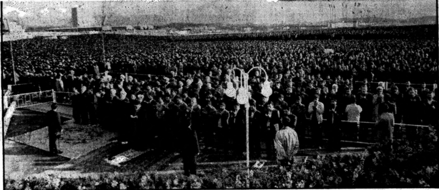
تماز پر شکوه عید سعید فطر با حضور گسترده مردم مسلمان و دین حنلی تهران برگزار شد. در این مراسم سفرا و نمایندگان کشورهای اسلامی نیز شرکت داشتند در پیام آغاز سال جدید

* ما سازندگی و رونق اقتصادی را برای نزدیک شدن به عدالت اجتماعی، رفع محرومیت و فقر، زدودن مناطق محروم از کشور و از بین رفتن فاصله فقیر و غنی می خواهیم و مسئولان و برنامه ریزان باید این جهت گیری انقلابی را در برنامه دوم رعایت کنند. * پیشرفت های ما به برکت منصرف نشدن از اصول انقلاب ممکن شده است و این در حالی است که دشمنان ما در تلاش هستند تا خلاف آن را وانمود کرده و پایبندی های انقلابی را مشکل آفرین معرفی کنند. * انحراف از اصول اسلام و انقلاب در عمل و فکر ما جز تا کامی و ایجاد مشکل نمی دیگری ندارد. * دشمنان می خواهند بین ملت و دولت و مسئولین و مردم جدایی ایجاد کنند و میان مردم با اسلام و هدف های انقلاب فاصله بیندازند. * احاد مردم بویژه جوانان باید این امر به معروف و نهی از منکر را در جامعه ترویج کنند و دستگاه های مختلف کشور نیز خود را هرچه بیشتر به موازین و اصول انقلابی و اسلامی نزدیک سازند. * رهبر انقلاب در اجتماع پرشکوه مردم مشهد ۱۱ جمهوری اسلامی ایران در برابر مطامع آمریکا و اروپا، قدرتهای سلطه گر و جاه طلبانه ای که با چند ملیتی قهرمانانه ایستاده است و هیچ کس اجازه زورگویی، دخالت و نفوذ در ایران اسلامی را نخواهد داد.