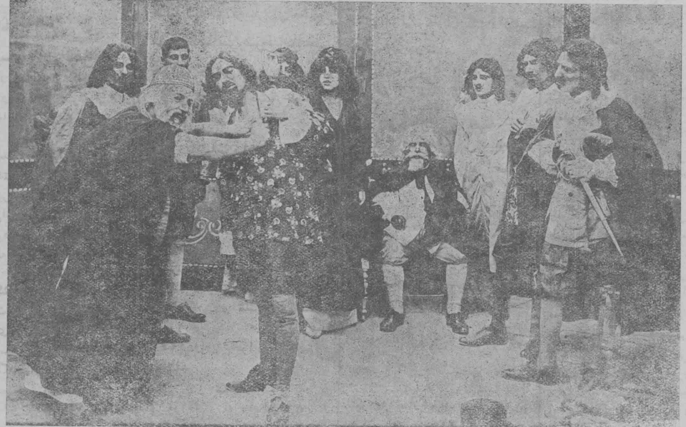
از راست بچپ سایو عاشق پرشیا - گراشیاو - منشی محکمه - حاکم ونیس پرشیا - نریسا - اتونو تاجر ونیسی - سالارو شائیلک تاجر کیمی

عدم توجه باین اصل ما را از داشتن مستخدمین امین و درستکار و فعال محروم خواهد نمود زیرا وقتی که نظامات و قواعد معینی در کارها وجود نداشته باشد طبعاً اختلال در پیشرفت امور حاصل خواهد شد مستخدمین فعلی دولت خوب باید هر چه هستند قطعاً بر آنها تکیه در آتیه میخوانند وارد مشاغل دولتی شوند مزیت دارند - اطلاعات این دسته در اصول اداری البته از متاخرین یعنی آن هائیکه بعد خواهند آمد زیادتر است و اگر بقیه بعضی مشاغل آزاد خوبست و بدبختی میکشاند را ببقارت و بدبختی میکشاند این قبیل نصایح برای اعیان مستخدمین مفید میباشد زیرا کسانی که وارد استخدام دولت شده اند و چند سالی هم بخدمت مشغول بوده اند اصول زندگانی آنها تغییر کرده و دیگر نمیتوانند مثل خود را عوض نمایند. بنابر این حقوق مستخدمین فعلی دولت باید محفوظ ماند، بدینیه است شغل آزاد و استقلال فکر و زندگی نعمت کرانها و بر قیمتی است که باید در زندگانی اجتماعی ما طرف احترام واقع شود ولی مستخدمینی که چند سال مشغول خدمت بوده و تشکیل عینه داده وقتی سالی منتظر خدمت شد برای اعاشه روزانه خود فوراً نمیتواند شغل آزاد خلق کند و دنبال کار تازه برود بعلاوه باید فراموش کرد که در مملکت ما مشاغل آزادی که تکفوی مخارج اشخاص معیول را بنماید وجود ندارد و یکی دو مؤسسه ملی هم کافی برای تمام کسانی که محتاج تهیه شغل هستند نیست و اگر بایست از استخدام دولت صرف نظر کرد در تلاش معاش مستقلی بود خوبست ناصحین این نکته را را در نظر بگیرند وسیع کنند که