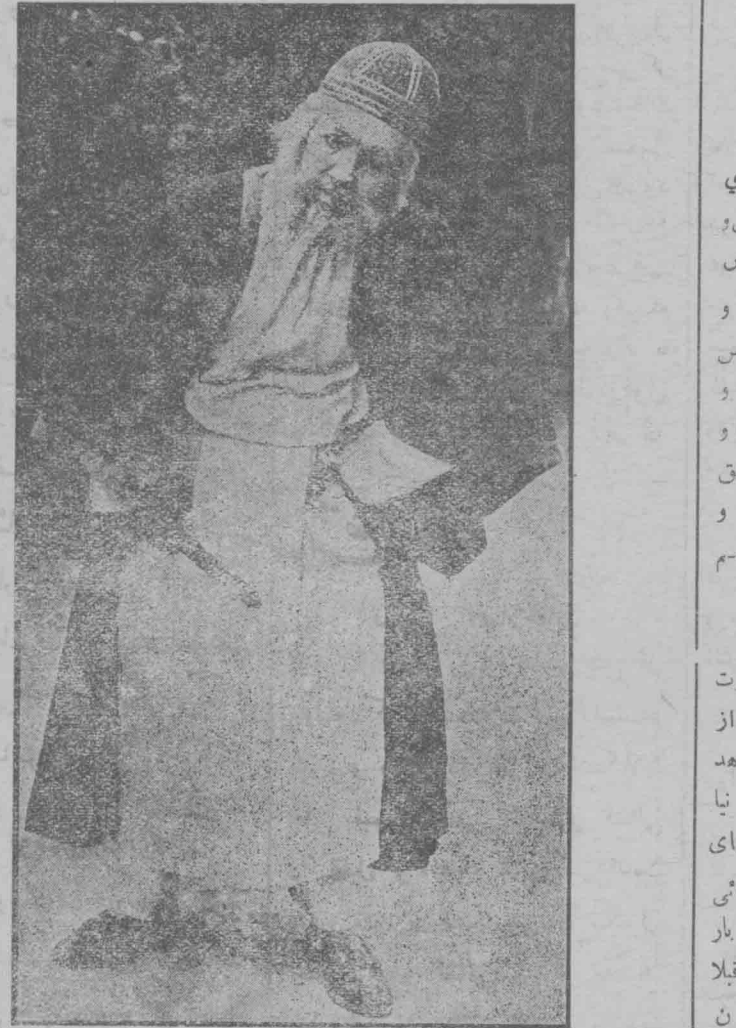
شائیلک تاجر کیمی

ایات فارس بوزارت داخله راجع مشروعی در موضوع شکایت تاجر راجع جالیات قالیهای جوهری تقدیم و اشعار میدارد باینکه تاجر شیراز از وضع مالیات مزبور شکایت می کنند بدینیه است که حتی المقدور در خوبی مال التجاره قالی و صدور جنس مرغوب و رنگ های ثابت باید دقت و توجه کامل بعمل