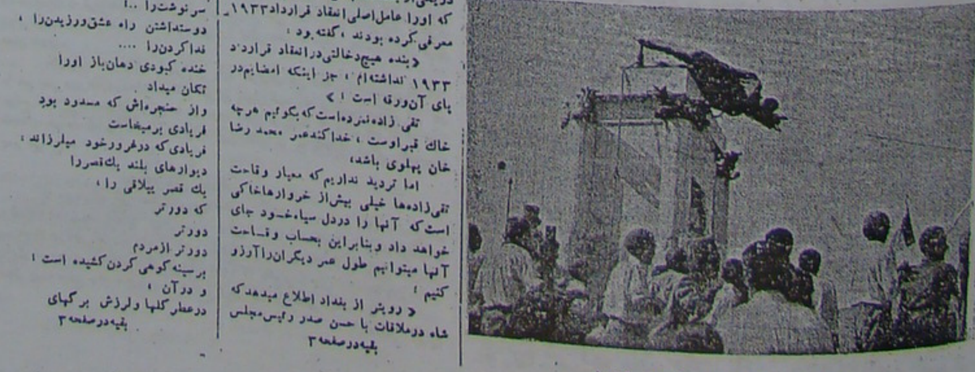
مردم مجسمه دیکتاتور را سرنگون میکنند

تقی زاده رئیس مجلس سنی مرحوم دو یکی از جلسات مجلس شانزدهم بنیاد کانی که او را عامل اصلی انعقاد قرارداد ۱۹۳۳ مصرف کرده بودند، گفته بود «بند هیچ دخالتی در انعقاد قرارداد ۱۹۳۳ نداشته ام، جز اینکه امضایم در پای آن درج است» تقی زاده نکرده است که بگویم هر چه خاک قبر اوست، خدا کند عمر محمد رضا خان بهلوی باشد، اما تردید نداریم که معیار وفات تقی زاده ها خیلی پیش از غرور اخلالگری است که آنها را دودل سپاه خود جای خواهد داد و بنابراین بحساب وفات آنها میتوانیم طول عمر دیگران را دراز کنیم «دویش از بنده اطلاع میدهند که شاه در ملاقات با حسن صدر رئیس مجلس پس در صحنه»