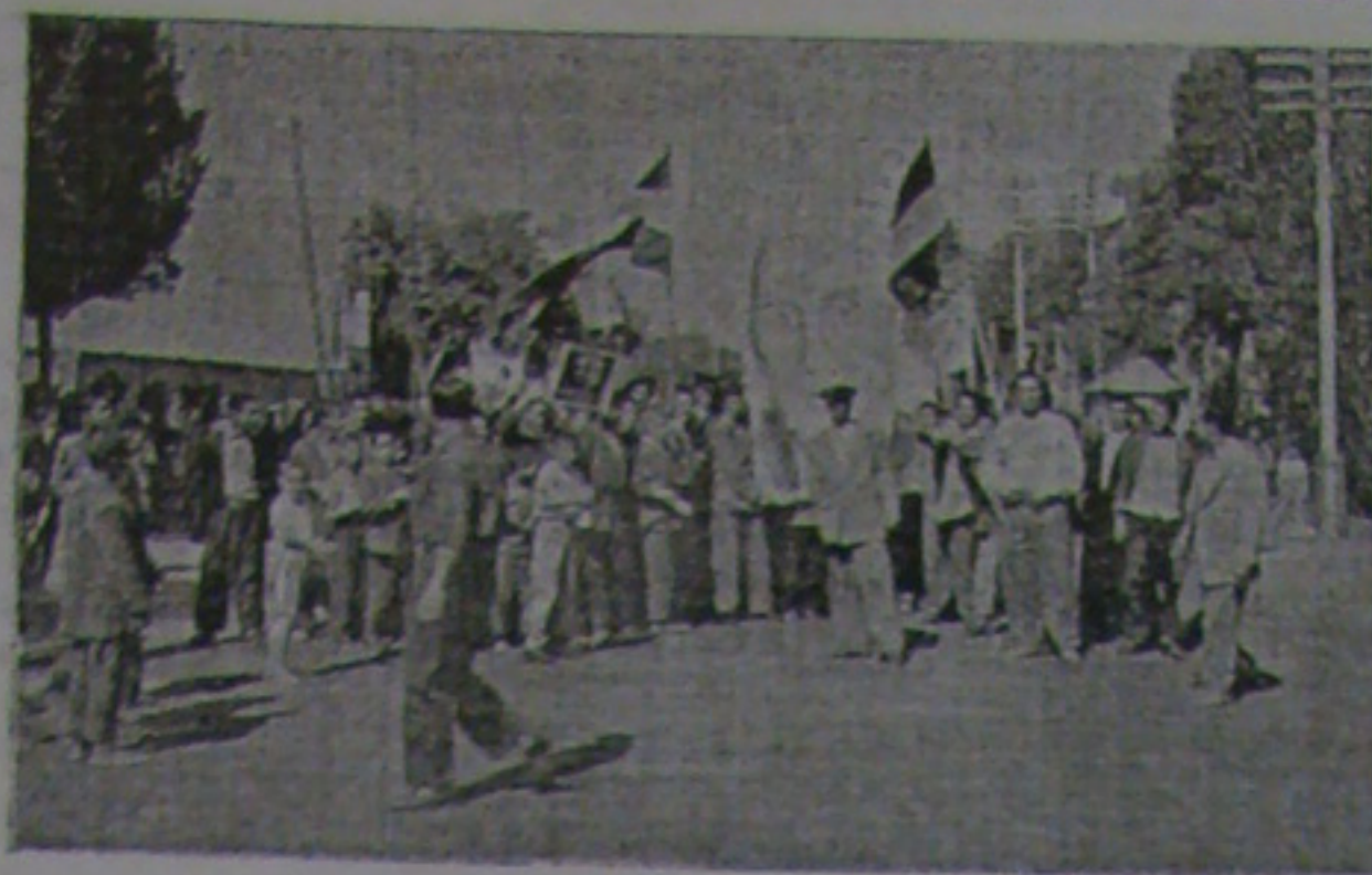
مردم مبارز تبریز نسبت به عدم قهرمان ایران اعتقاد میکنند