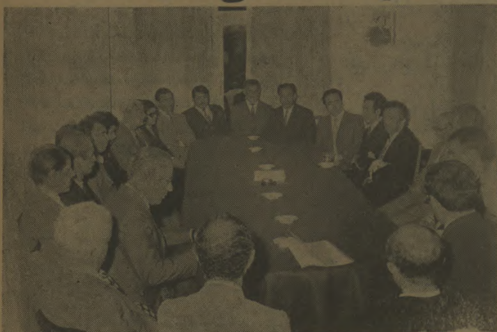
عکس، گوشه‌ای از مراسم اجتماع نمایندگان مردم اربابان و اهری‌های مقیم پایتخت راهنگام معارفه بان دبیر کل حزب مردم نشان می‌دهد

دستگاه‌های دولتی مسائل روزمره را دنبال می‌کنند و برنامه صحیحی ندارند