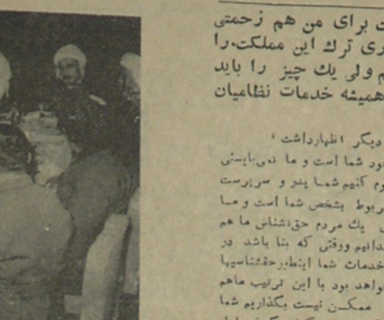
با اقداماتی که در پیشرفت امور اجتماعی از طرف موسسه پپسی کولا تاکنون بعمل آمده این موسسه توانسته است دوستان صدیق و وفاداری برای خود بدست آورد امروز همه مردم در مجالس رسمی و مهمانیها پپسی کولا مینوشند زیرا پپسی نوشابه مورد علاقه همگانی است

آنگاه برای سر و سورت دادن بوضع درهم و آشفته نظام شروع با اقدامات اساسی کرد و در قصر قاجار اردویی تحت ریاست سرلشکر احمد آقا خان تشکیل داد و پس از آنکه وزارت جنگ را از حالت مستقره و نامعلوم آرزویی که از یک نفر وزیر نظام