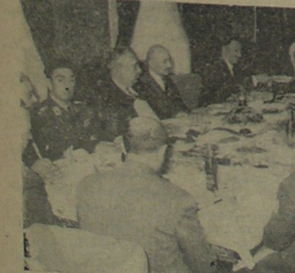
با اقداماتی که در پیشرفت امور اجتماعی از طرف موسسه پپسی کولا تاکنون بعمل آمده این موسسه توانسته است دوستان صدیق و وفاداری برای خود بدست آورد امروز همه مردم در مجالس رسمی و مهمانیها پپسی کولا مینوشند زیرا پپسی نوشابه مورد علاقه همگانی است

آنگاه برای سر و سورت دادن بوضع درهم و آشفته نظام شروع با اقدامات اساسی کرد و در قصر قاجار اردویی تحت ریاست سرلشکر احمد آقا خان تشکیل داد و پس از آنکه وزارت جنگ را از حالت مستقره و نامعلوم آرزویی که از یک نفر وزیر نظام