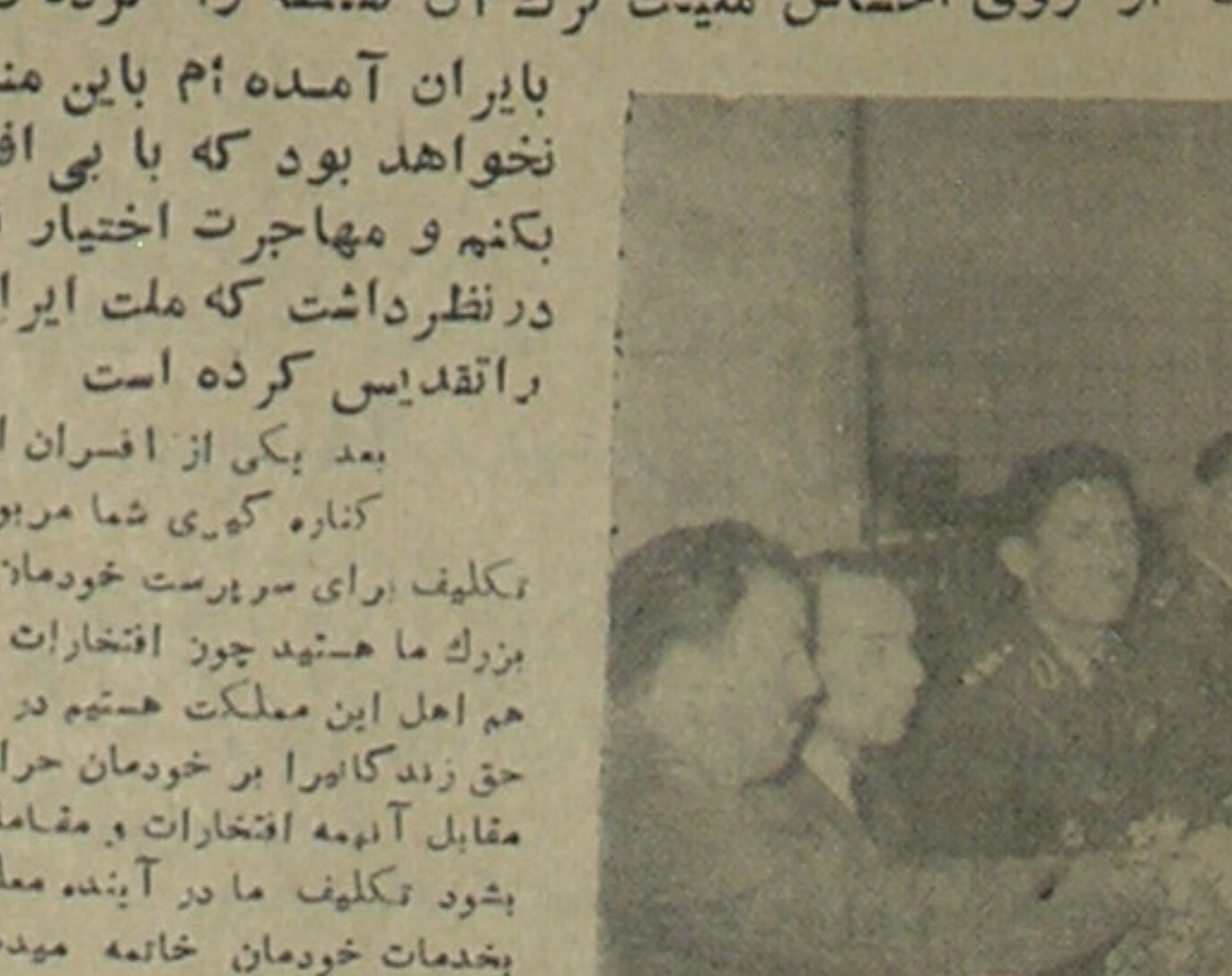
پپسی کولا در اجرای جشنهای ملی گمگهای فراوان میکند و قهرمانان ورزشی را همیشه بنحوشایسته ای مورد تئو و فرامیگرداند در همه مجالس و در تمام جشنهای بزرگ کارخانه پپسی کولا با نوشابه فراوان خود پذیرایی گرمی میکند

شماره کویلاوست اشخاص مصیبت سر و سوری و داموفاک کوت سرف کیم است سبب چند ش رها برای رقم از بروت کرون هی کت که مان را کردیم ولی دن فراغت یا دو دست حضرت آقا زودن خدا چنان ادامه روی آتش از نه بسترش ریخت خنواد فل مقررات بشکونه اعمال ای در اینجا قر زده اید هر عملی در عاری بدار بود و باید ب و روش فر خارج بقای خود اعمال بی بر نیاروید ت ما مخرب ن و اعتراض نمودند ن روش را با بان شد نه های او در تمجید ندان کردن مرفق انداختن این اشخاص ورد اجتماع ی پیدا موشوند بدانند یا باق میشوند و بکناسی ل با پسند پیش همه اینکه دستی قله میزنند ب باها را نراقیان را قایل نه اشخاص بت آنها خود با آن هام لاقل تا و آداب ن که از نو و خوات که تو و صدیق کرده را که ما رضا مظالم غلا در مسکو که سفیر در این مورد نی اظهار ماده که آشنا تر دوری منسوب ی ای روسی را ایران نشانی