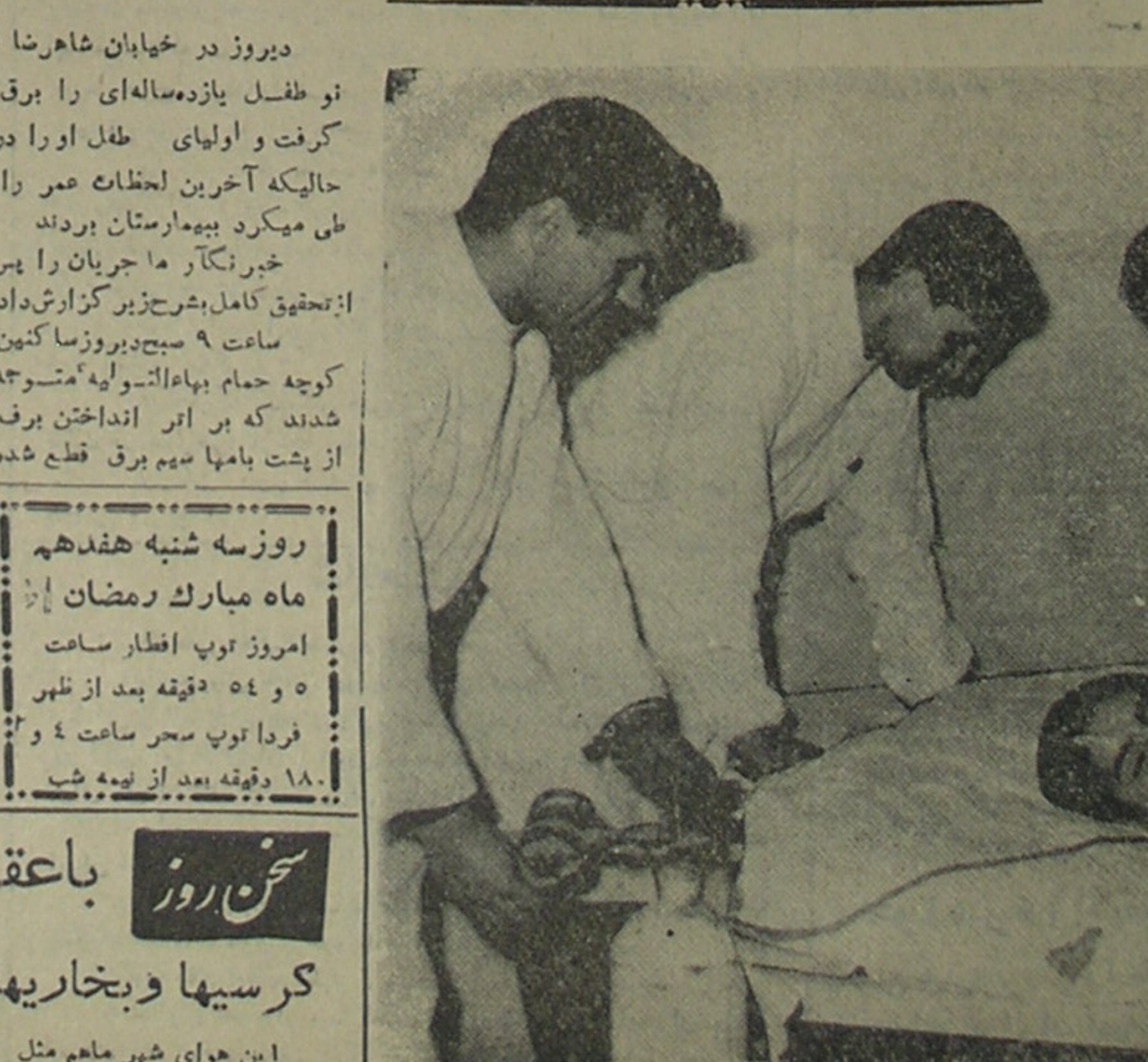
طفلی را در میان کوچه برق گرفت ولی پزشکان او را از مرگ نجات دادند

طفل نا امید بودند و می گفتند او را مرده ب بیمارستان آورده اند پس از یک ساعت صدای گریه طفل بلند شد و بالاخره نجات یافت - پدر طفل میگوید فرزند مرا حضرت رضا (ع) نجات داد