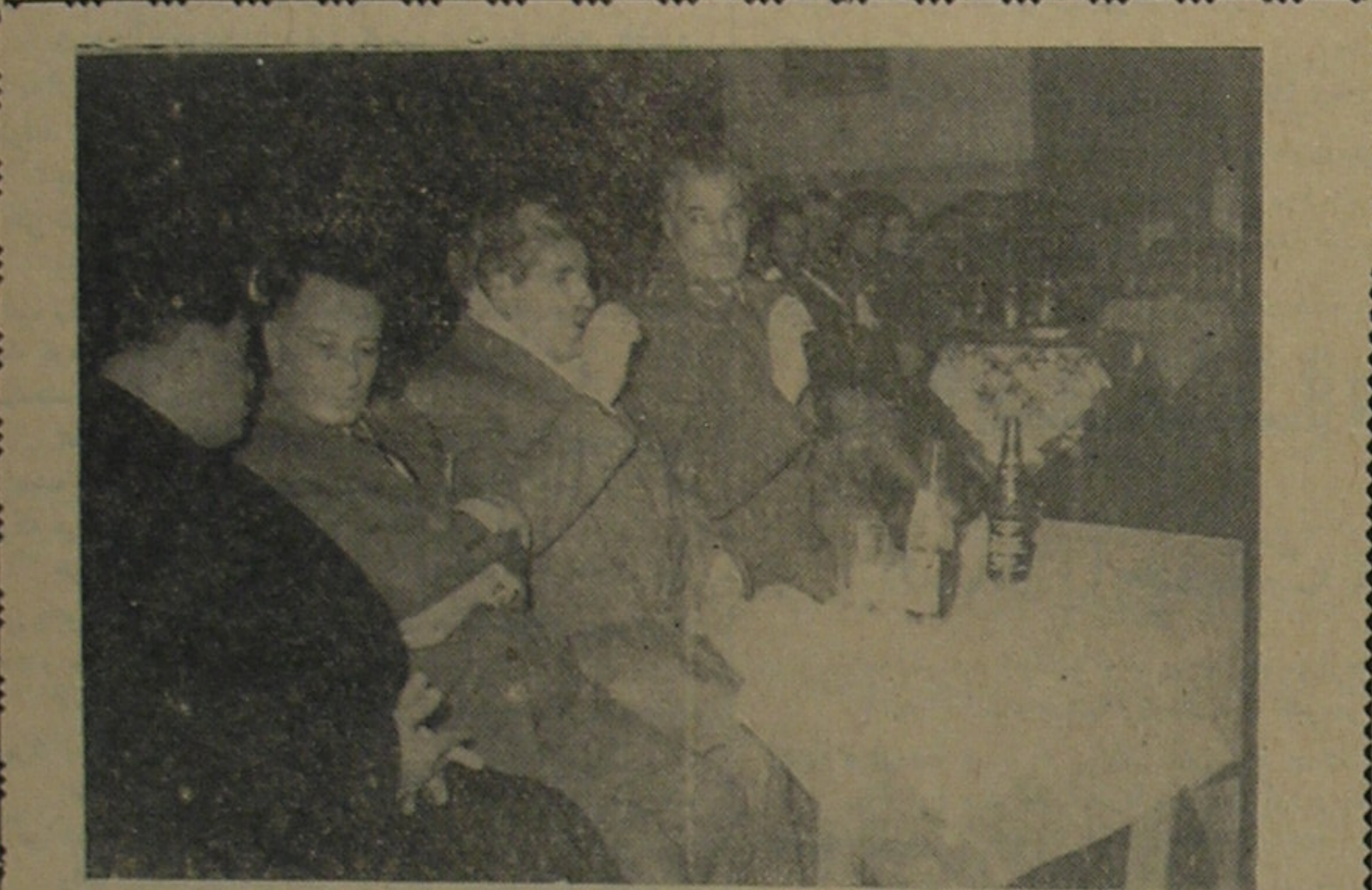
موسسه پپسی کولا علاوه بر آنکه نوشابه مطبوعی در اختیار مردم گذارده همیشه در بزرگداشت آداب و سنن ملی و باستانی پیشقدم میشد در جشن بزرگ سوم اسفند موسسه پپسی کولا مشهد بیکلیه هنرمندان که برنامه های جالب جشن را اجرا کرده بودند جایز برپایی داد و بایستی کولا از همه پذیرایی کرد

آقای وزیر جنگ با طاق خودشان مراجعت کرده و بفاصله یک ربع ساعت بمنزل شخصی خودشان رفتند