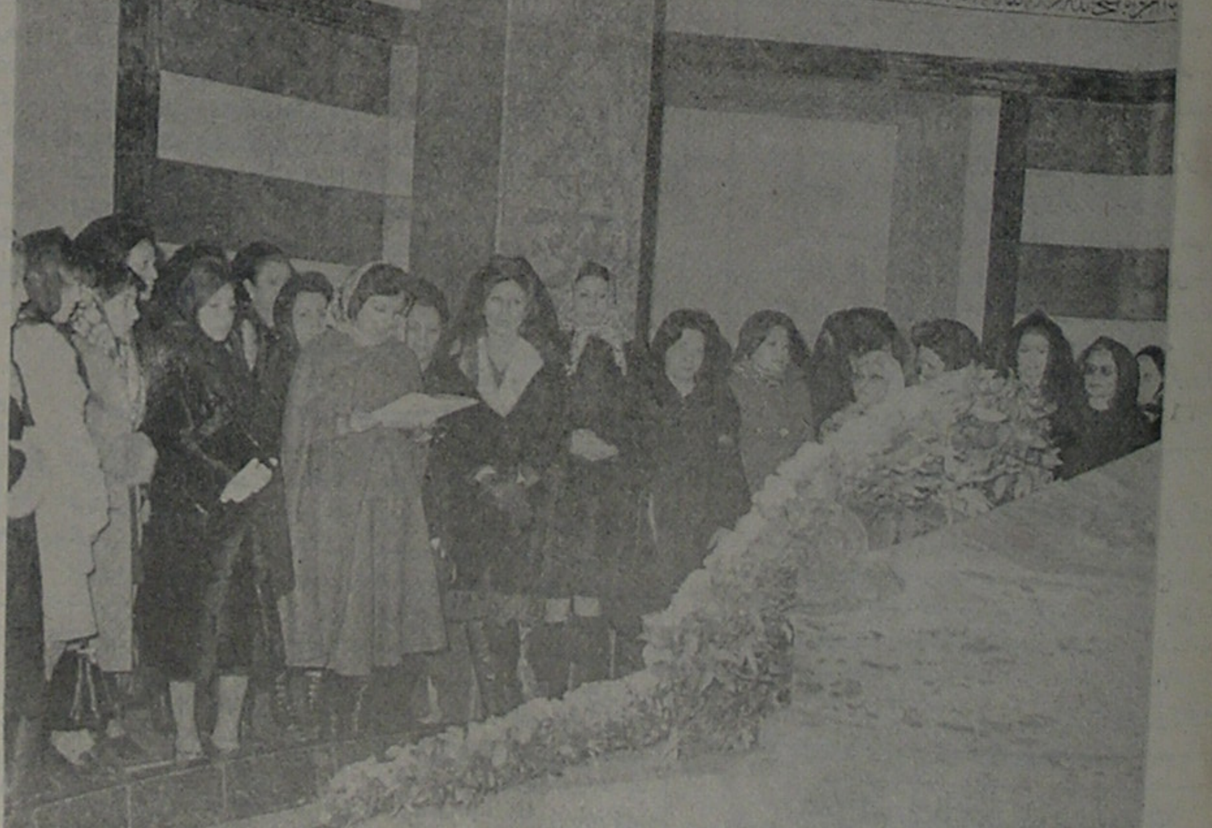
بهمناسبت هفدهم دی سالروز آزادی زنان ایران گروهی از نمایندگان زنان در آرامگاه علیاحضرت رضاشاه کبیر بنیانگذار ایران نو حضور یافتند و با نثار تاج های گل نسبت به سردار بزرگ تاریخ ایران ادای احترام کردند.

قسمت عمده و اساسی مباحث جاری در مطبوعات جهانی بطور اتم، و در مطبوعات منطقه و بالاخص در نشریات کشورهای مختلف عربی دور و نزدیک، معطوف به نتایج سفر و دیدار جاری رهبر بزرگ ایران و شهبانوی گرامی ما از سرزمین های اردن است. طبعاً مراکز خبری و رادیوهای تلویزیونی نیز بر این زمینه مطالب و تفسیرهای فراوان دارند که قطعاً خوانندگان ما هم در جریان این اخبار با تفسیرها هستند و بطور کلی این روزها مرتب هر ایران هزارگانه در ساعات مختلف در باره این مسافرت و مذاکراتی که سران ایران و اردن از یک سو و ایران و مصر در روزهای آینده انجام داده و می دهند بر سر جبهه یقیه در صفحه ۷