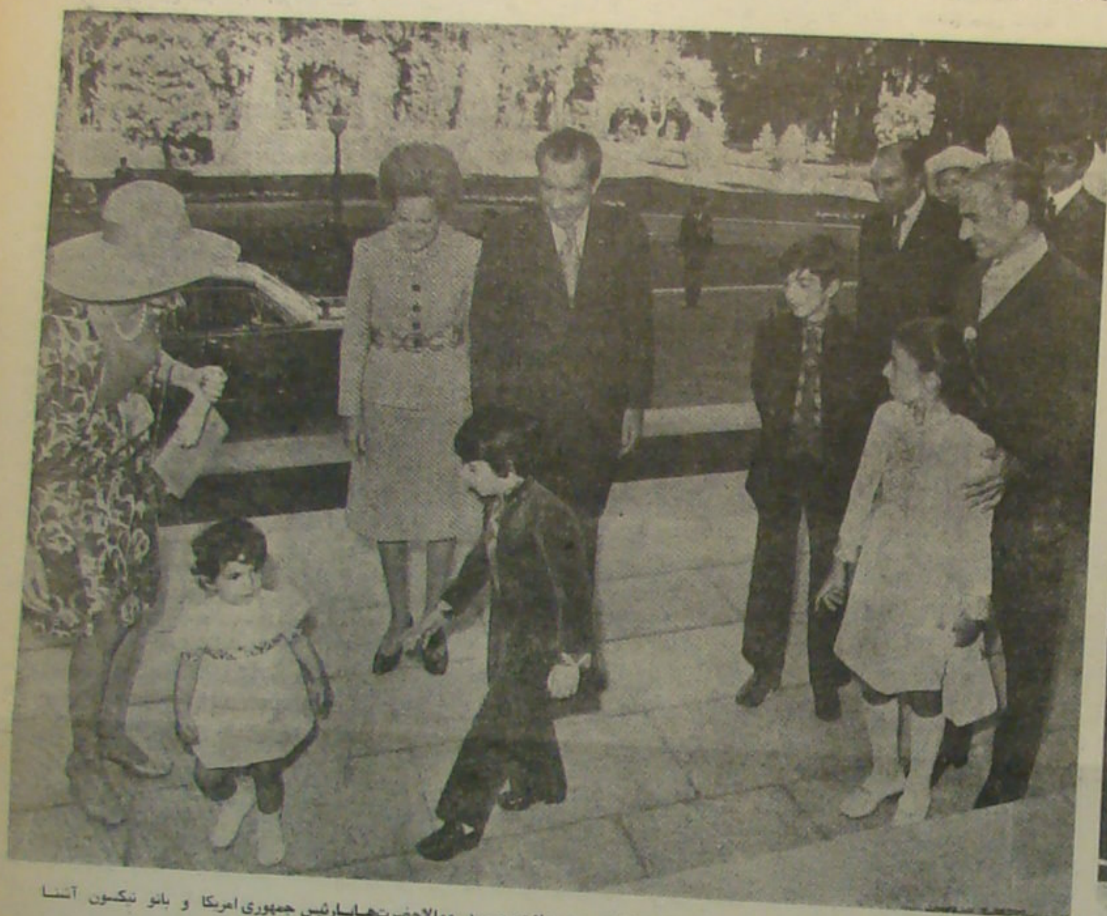
هنگام ورود میهمانان شاهشاه و شهبانو به کاخ سعدآباد و الاحضرت ولایت‌مندی و الاحضرت هابار شین جمهوری آمریکا و بانو نیکسون آنجا می‌شوند.