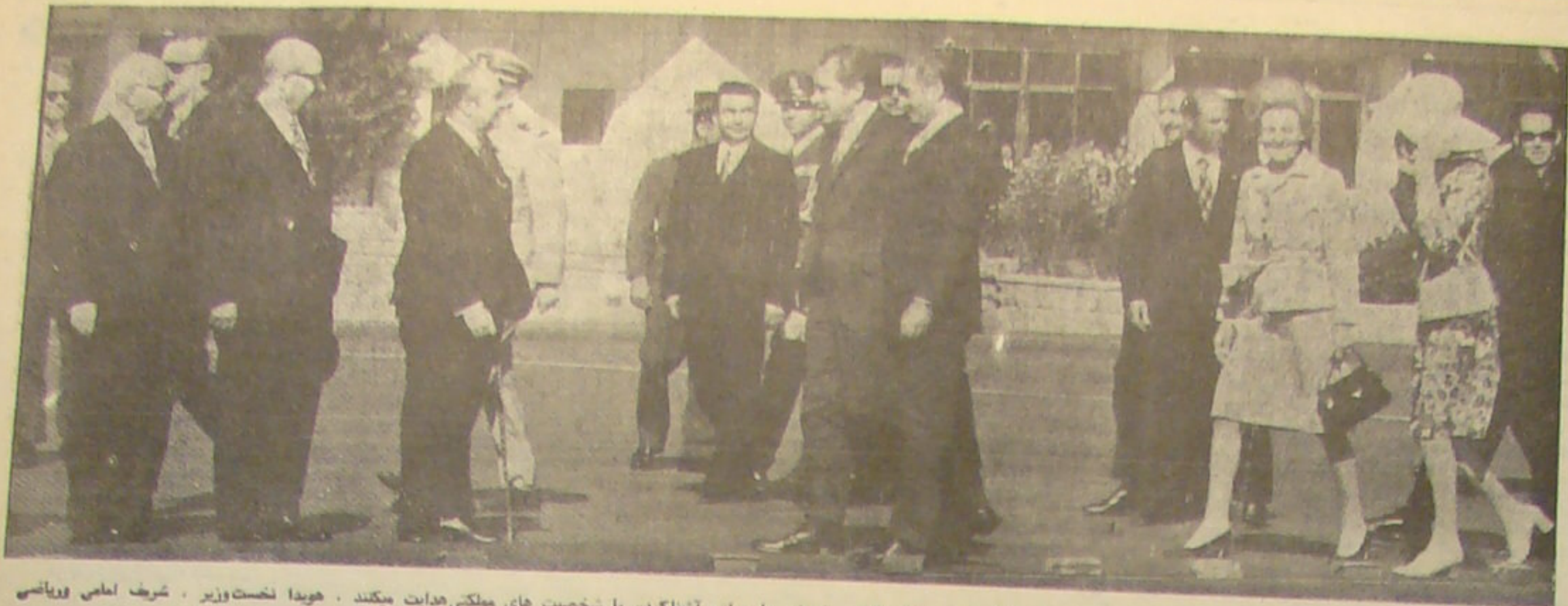
شاهشاه آرمانگر، مهمان‌های قدر خوش را برای آشنا کردن با شخصیت‌های مملکتی هدایت میکند. هودا نخست‌وزیر، شرف‌امامی و ریاستی روسای مجلسین در انتظار هستند. در کنار عکس علی‌احضرت شهبانو و خانم نیکسون هنگام گفتگو با یکدیگر دیده می‌شوند.