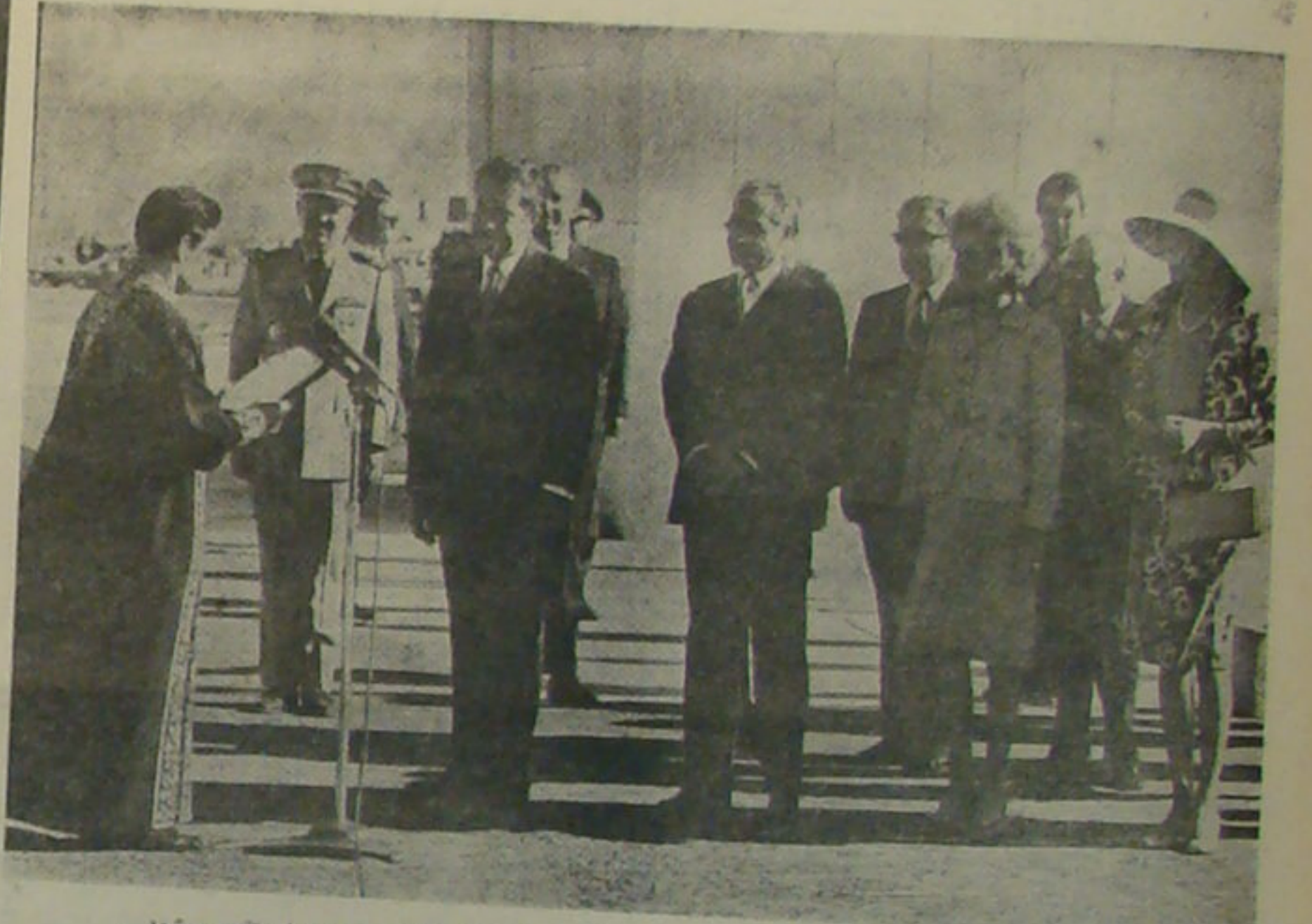
رئیس‌جمهوری آمریکا، نخستین رئیس‌جمهوری است که در میدان شهدای کلد طلایی شهر به او تقدیم می‌شود. در عکس شهردار تهران از طرف مردم پایتخت خیر مقدم می‌گوید. در میان شاهشاه و بانو نیکسون کی سینجر مشاور مخصوص ریاست‌جمهوری در امور امنیت ملی و در میان شهبانو و بانو نیکسون، آقای هودا نخست‌وزیر دیده می‌شوند.