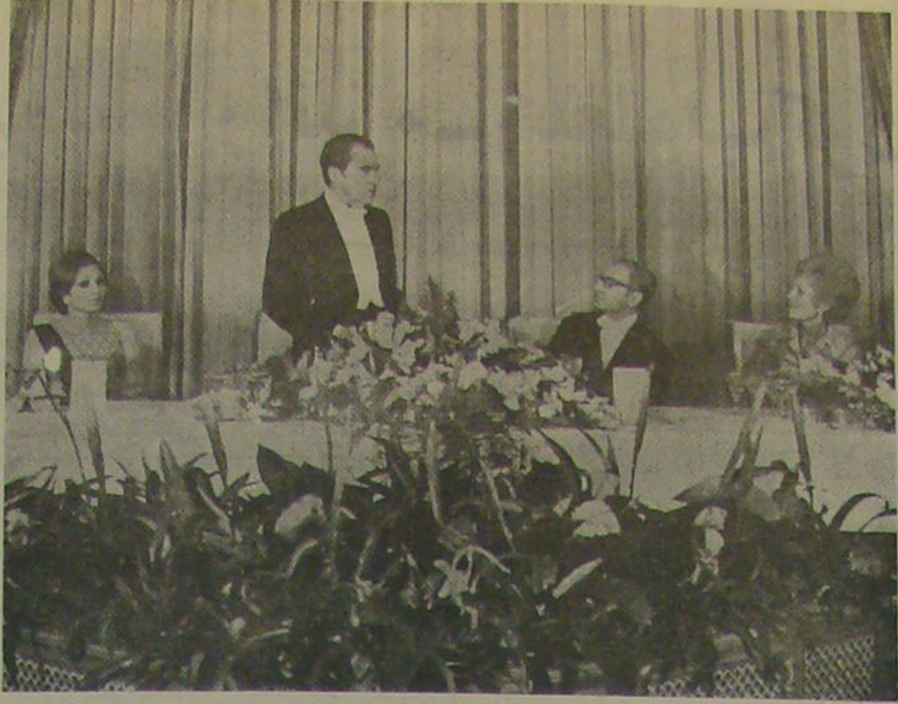
در صیافت دبشاهنشاه آریامهر و علیاحضرت‌شهبانو باضخار میمانان خود، رئیس جمهوری آمریکا دریاخ شاهنشاه سخن می‌گوید.

کتاب نسخه اصلی یک مجلس اعتباری کمی به در جلسه دیروز شورا، هنگام بحث در لایحه تریغ بودجه سال ۱۳۴۷ ستاورد، جری شرکت‌های دولتی، به دیوان محاسبات حساب نمی‌دهند، فراین جلسه اعلام شد یک نسخه اصلی و حتی از کتابی کمتر بنا بوضع آتاله کتابی به مجلس تقیم شده. لایحه در مخالفت با لایحه تریغ بودجه سال ۴۷ تصویب شد. با استناد به ماده ۱۳۱ قانون اساسی، دولت موظف است که در هر سال بودجه را به مجلس شورای ملی ارائه دهد. در این مورد، مجلس شورای ملی با استناد به ماده ۱۳۱ قانون اساسی، از تصویب بودجه سال ۴۷ بدون آنکه دولت به مجلس تقیم شده باشد، امتناع کرد.