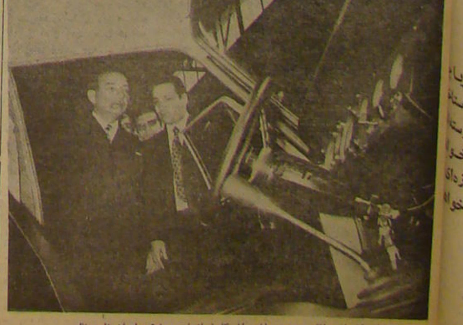
مجلسه ای از بازدید آقای محمود ریاض از کارخانجات صنعتی ایران تاسیسات

کاربران ایران تاسیسات یک ایران تاسیسات واقع در کیلومتر عربی قرار گرفت . ترمینال پیکان به صلیب سرخ ۱۸ جاده کرج مورد بازدید آقای محمود ریاض معاون نخست وزیر امور خارجه جمهوری متحده عرب قرار گرفت . محمود ریاض معاون نخست وزیر امور خارجه جمهوری متحده عرب از ظهر چهارشنبه کارخانجات وزیر امور خارجه جمهوری متحده عرب را در تهران دید.