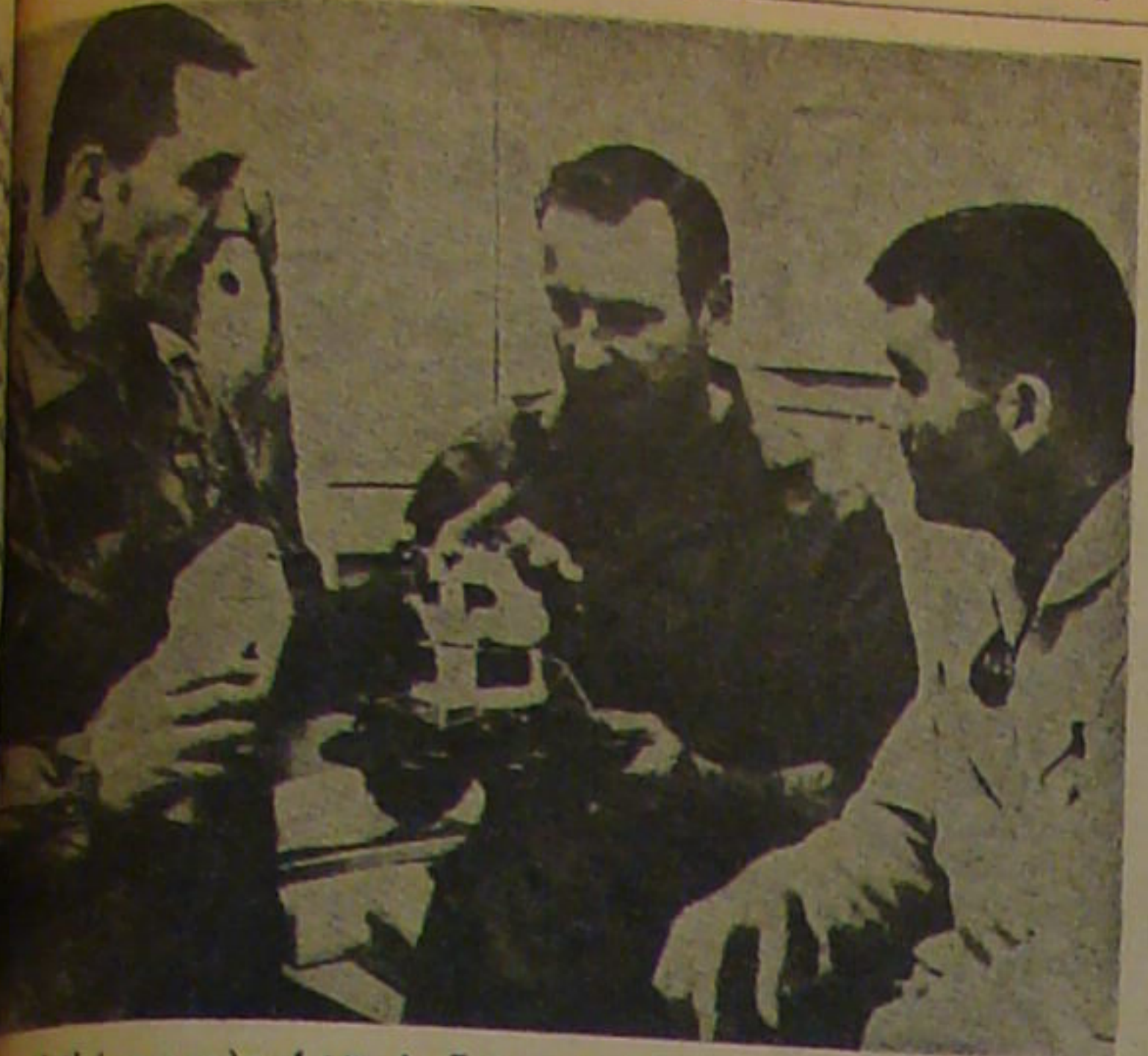
جان سوگرت که نفر علی ابدال پرواز آبولو ۱۳ است (سمت چپ) با آقایان (وسط) و فردهایز نمونه سفینه ماه شین را بررسی میکنند.

آبولو ۱۳ ساعت ۲۲:۴۳ امشب سوی ماه پرواز خواهد کرد. - شنبه ۲۲ فروردین - آبولو ۱۳ با ۳۱ سرشین از کتب کندی سوی ماه پر از آب میشود. این سومین سفر انسان به ماه ظرف ۹ ماه است. - ساعت ۲۲:۵۵ سفینه در ارتفاع ۱۹۱ کیلومتری روی مدار زمین قرار میگیرد. - یکشنبه ۲۳ فروردین ساعت ۱۸:۱۸ سومین سفینه موشک روشن میشود. آبولو ۱۳ حوزه جاذبه زمین خارج میشود. سوزش همگامی که اجسام را در ارتفاع ۲۰۰ کیلومتری از سطح زمین در پیشتخت چسبیده در مدار این ساختمان قرار میگیرد. توجه به این گزارش، وزارت صنایع و معادن در پی تسریع در ساختن هتلهای فارس است. اهمیت خاصی دارد.