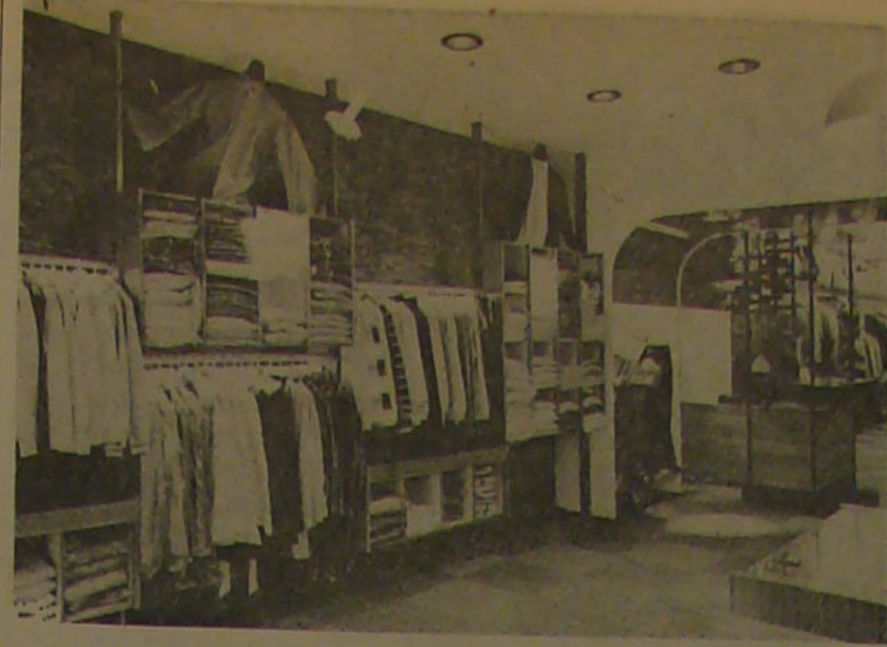
مغازه های پیش ساخته

اصال از سیاه پاره خیری نیست کارخانه تهیه غذای کودک در زمینی به مساحت ۲ هزار متر مربع در جوار کارخانه شیرپاستوریزه تهران ساخته شده و با نظارت کارشناسان فنی به سازمان ملل متحد سالانه ۷/۲ میلیون قوطی محصول تولید خواهد کرد. مواد اولیه مورد نیاز این کارخانه را آرد، غلات، شیر خشک، مواد معدنی و ویتامین های لازم برای رشد کودکان تشکیل میدهد. بعضی از محصولات این کارخانه کمبودی که از نظر تامین مواد خوراکی مورد لزوم کودکان کم رتبه وجود داشت برطرف خواهد شد.