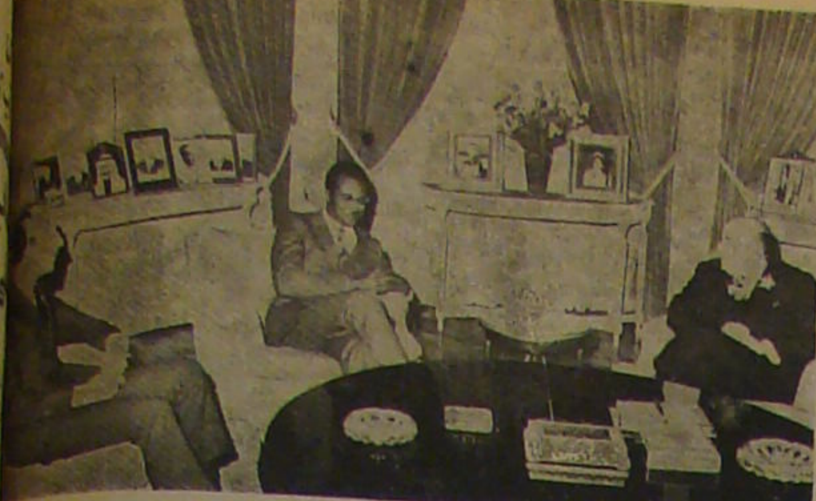
وزیر اطلاعات مغرب روز پنجشنبه با آقای جواد منصور وزیر اطلاعات کاخ تخت و وزیر با آقای هویدا نخست وزیر ملاقات کرد. عکس این دیدار را نشان میدهد.