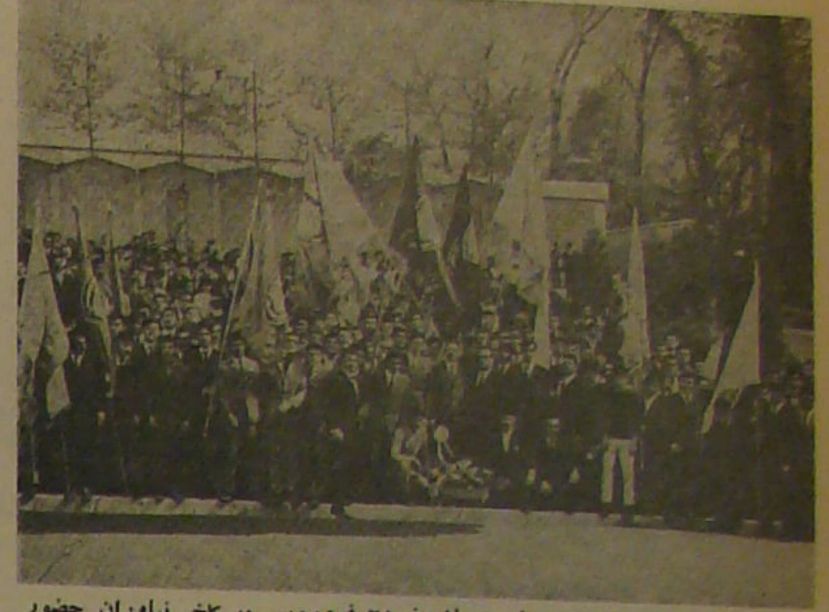
دانشجویان دانشگاه بمناسبت سالروز ۲۱ فروردین در کاخ نیاوران حضور یافتند و با سخنرانی و نمایش عکس شهدای از دانشجویان را در کاخ نیاوران نشان میدهند.

بمناسبت سالگرد بستم و یکم فروردین بمقام شهسواران لشکری و پهلوی