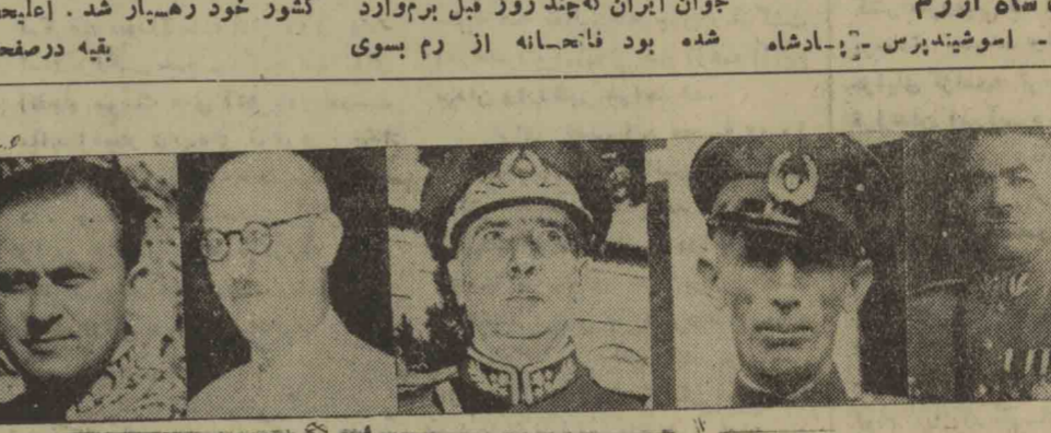
از راست بچپ سرلشکر باتماقلیچ رئیس ستاد، سرتیب دفتری رئیس شهربانی کل، سپهبد شاهبختی استاندار و فرمانده لشکر آذربایجان، علی هیئت استاندار فارس، احمد ملی بی آرم سرپرست استانداری تهران...