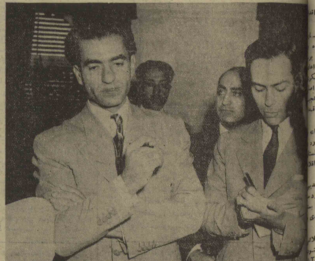
شاهنشاه در جلسه صحابه مطبوعاتی با خبرنگاران در زم