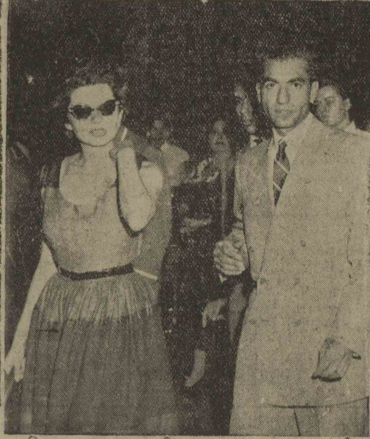
شاه و ملکه در فرودگاه زم