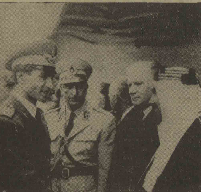
لادرتیف سفیر کبیر شوروی: حیزه غوث وزیر مختار عربی سعودی امروز در فرودگاه از طرف شاهنشاه مورد تهنیت قرار گرفتند