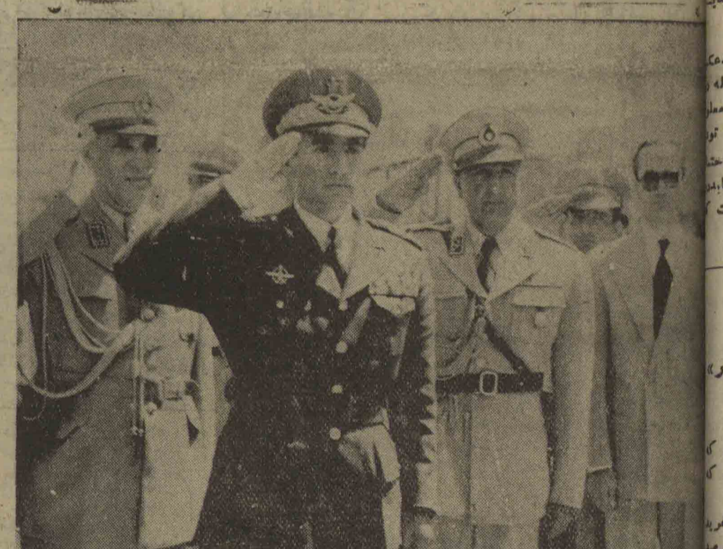
شاهنشاه در فرودگاه هنگامی که موزیک سلام شاهنشاهی را مینوازد