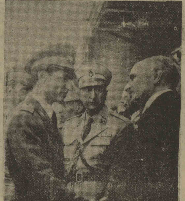
شاهنشاه نسبت به ندرسن سفیر کبیر امریکا در فرودگاه ابراز تهنیت میفرمایند