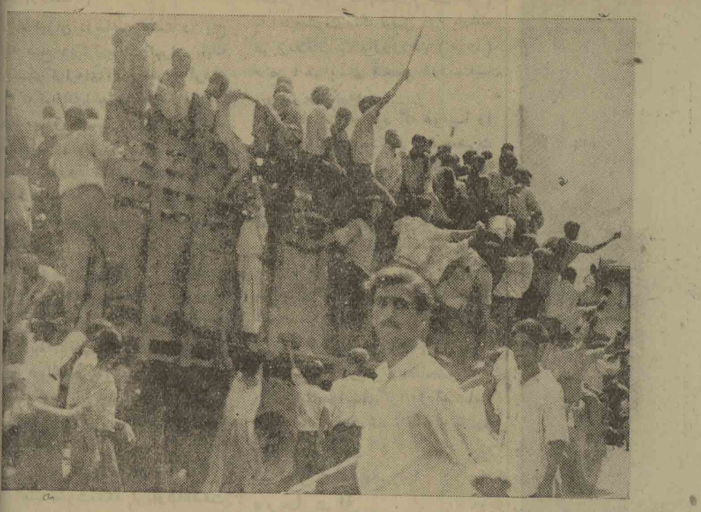
گوشه ای از تظاهرات ربیروز مردم در رشت