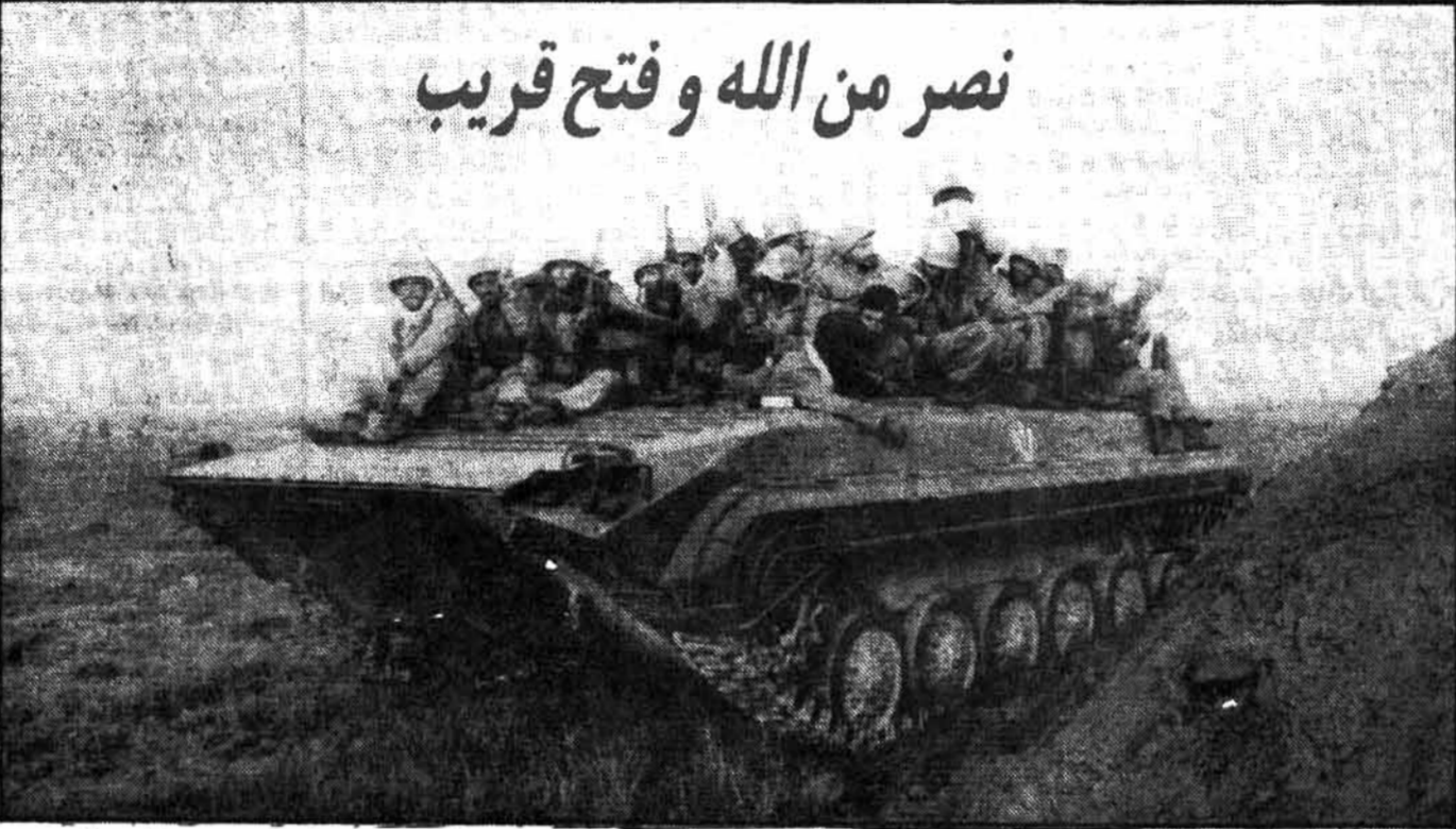
نصر من الله و فتح قریب

در انتظار فتح نهائی: رزمندگان پیروزمند اسلام که از نیمه شب دیشب در سراسر جبهه بحال آماده باش کامل درآمده اند، در انتظارند تا با صدور فرمان حمله سراسری، خاک ایران را برای همیشه از لوث وجود کفار و مزدوران متجاوز پاک کنند.