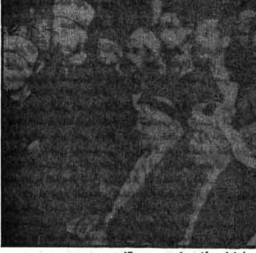
کنگره مسلمانان فلسطینی در قاهره

مسلمان عرب در این کشور سکنی داشت. رهبری این جمع را حاج محمد امین الحسین مفتی بیت المقدس بعهده گرفت. امین الحسین از یک مسلمان عرب در این کشور سکنی داشت.