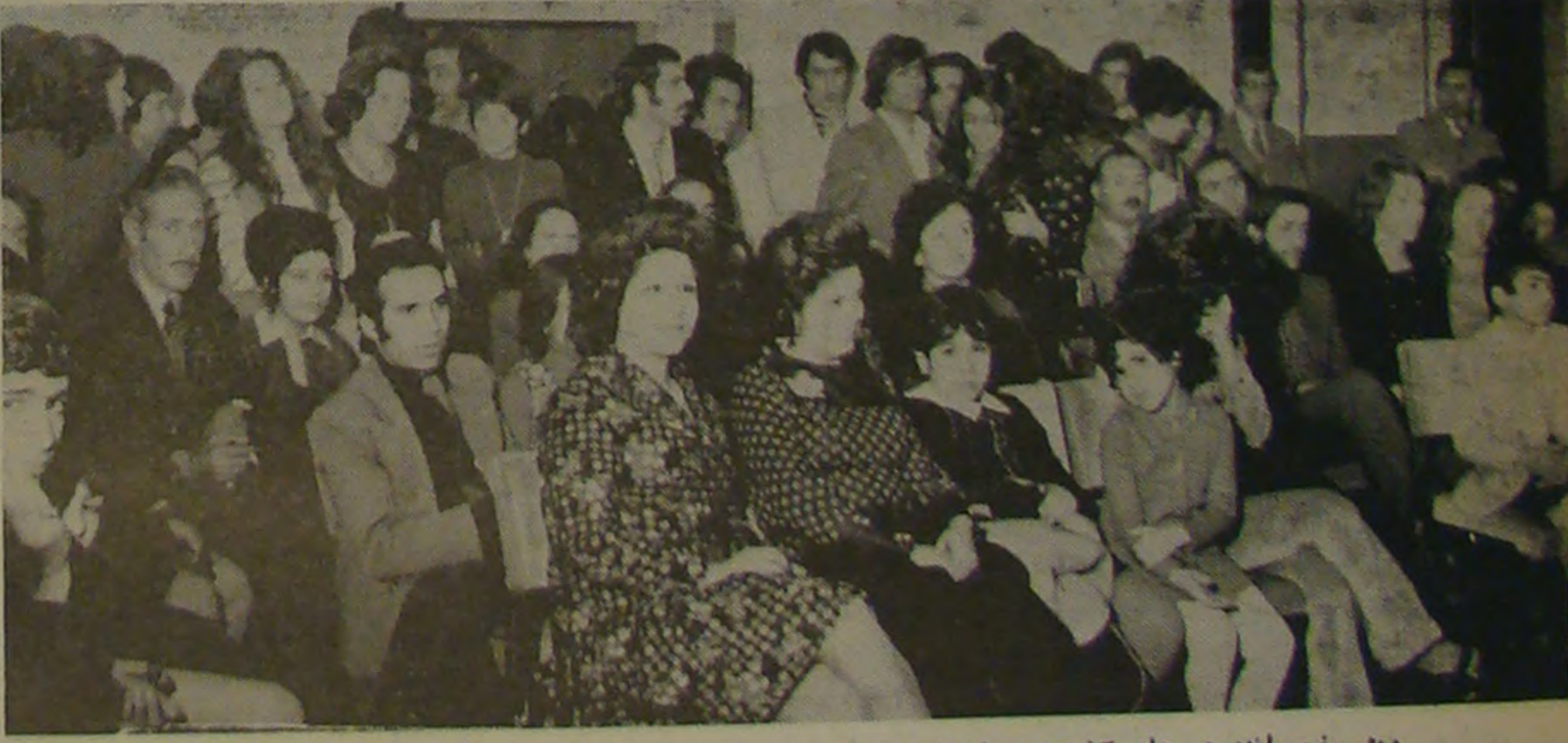
دیشب نیز مانند شبهای گذشته در باشگاه حزب ایران لوین مجلس جشن و سرور بزرگداشت دهه انقلاب برپا بود و هزاران نفر از هممسلکان با اعضای خانواده خود در این جشن شرکت داشتند.