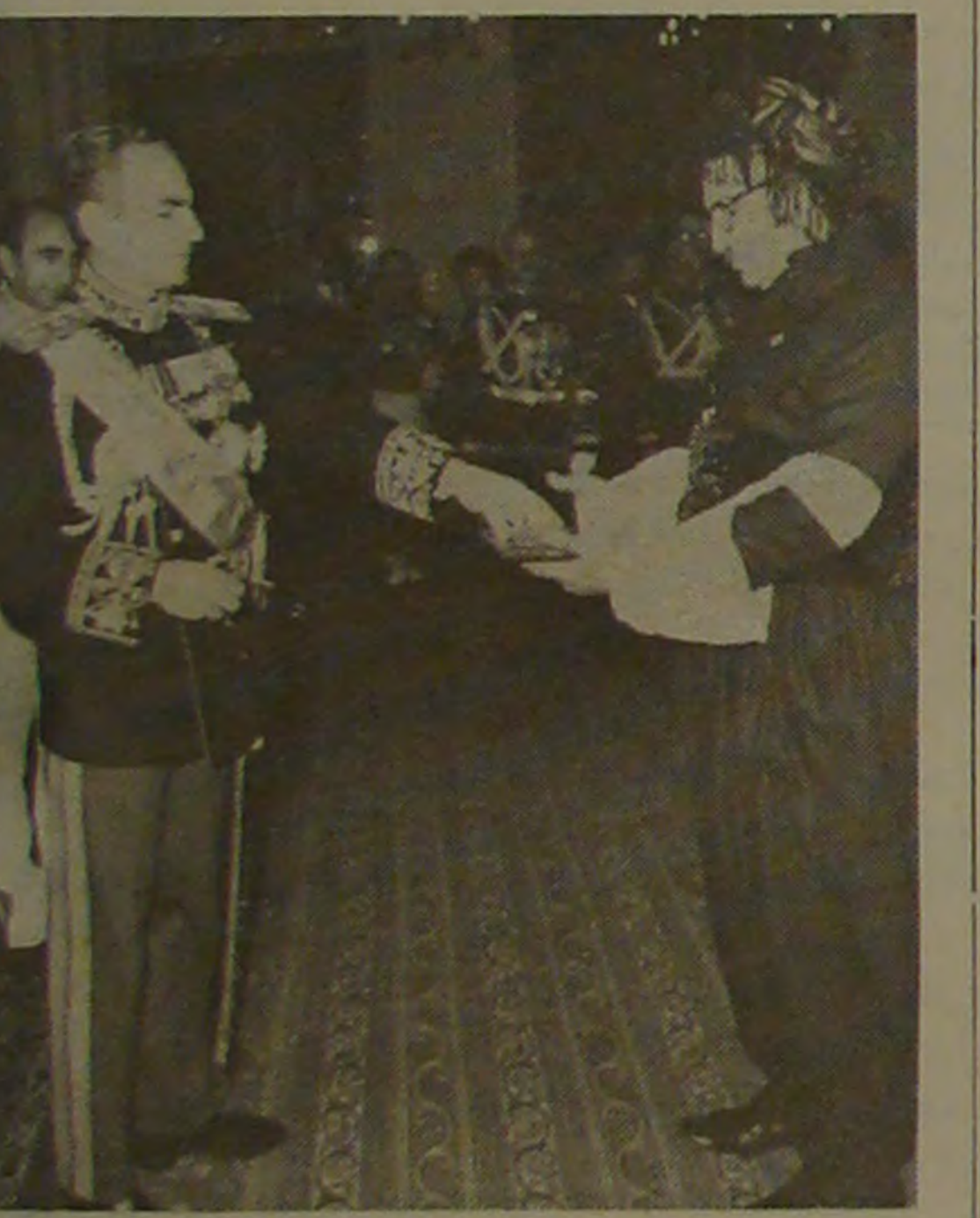
رئیس کنگره بزرگداشت همه انقلاب هتنام تقدیم بزرگترین سکه طلای دنیا به پیشگاه شاهنشاه آریامهر.

• لیندون جانسون در اوت ۱۹۰۸ در تگزاس دیده به جهان گشود بود وی اولین رئیس جمهوری امریکائی ایالات جنوبی امریکا بود.