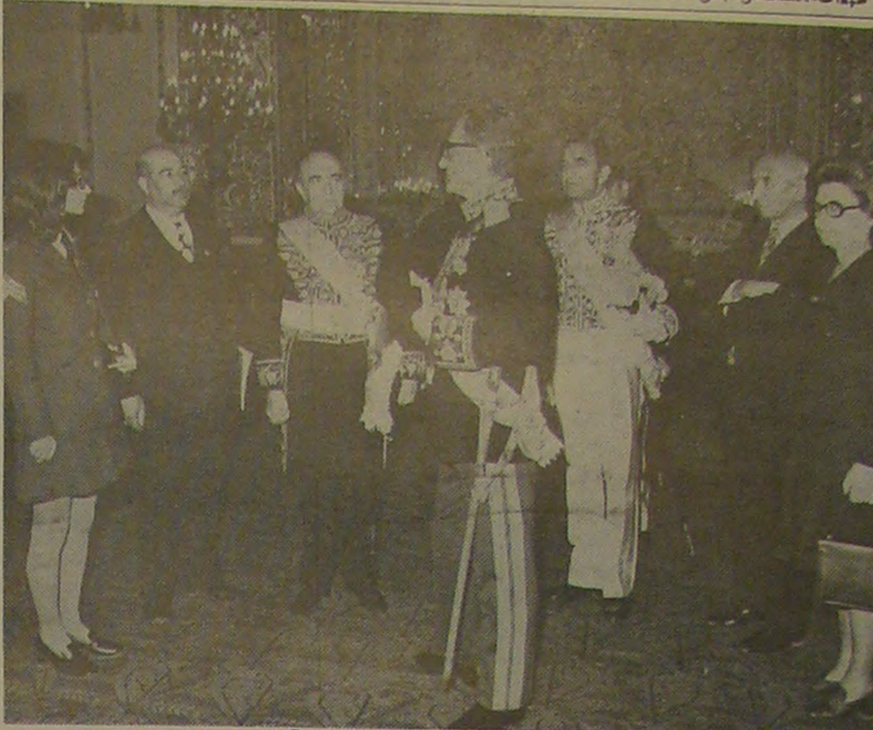
دیروز اعضای کمیته مدارک بزرگداشت انقلاب بحضور شاهنشاه آریامهر شرفیاب شدند در این شرفیابی آقای هویدا نخست وزیر و آقای علم وزیر دربار شاهنشاهی حضور داشتند

• بمناسبت عید سیم غدیر غم ساعت ۱۰ دیروز مراسم سلام رسمی با حضور نایب القابله آستان قدس رضوی و آستاندار خراسان در سالن تشریفات استعانتی برگزار شد. • مقامات وادان دانشگاه پهلوی شورای در تالار پهلوی این دانشگاه اجتماع کردند و ضمن تشریح و تیزیه و تحلیل آثار و نتایج انقلاب سازنده شاه و مردم رهبر بزرگ آنرا مورد تجلیل قرار دادند. • پیش از ظهر دیروز بمناسبت عید سیم غدیر غم مراسم سلام رسمی با حضور آستاندار سیستان و بلوچستان در زاهدان و در شهرستان های این استان با حضور فرمانداران برگزار شد. • پیش از ظهر دیروز مراسم سلام عهد غدیر غم با حضور آقای دهستانی آستاندار آذربایجان غربی در تالار اجتماعات شهر داری رضایه برگزار شد. • بمناسبت دهمین سال اخلاق دیروز در ستان با حضور فرماندار کلستان و جمیع کتبی از اهالی و فرهنگیان جشنی بزرگوار شد. همچنین شورای داری ستان در سالن شهرداری ستان افتتاح شد. • از طرف کارکنان و دانش آموزان دبیرستان فردوس شمیران مراسم باشکوهی بمناسبت بزرگداشت سالگرد نخستین دهه انقلاب در سالن نمایش دبیرستان مذکور برگزار شد. • در شهرستانها و بخشهای استان کرمانشاه، فرماندار پهلوی کل میدان - ایلام و یسکوه و لرستان بمناسبت تقارن عید سیم غدیر با جشن بزرگداشت دهمین سال انقلاب مجالس جشن و شادی برپا گردید.