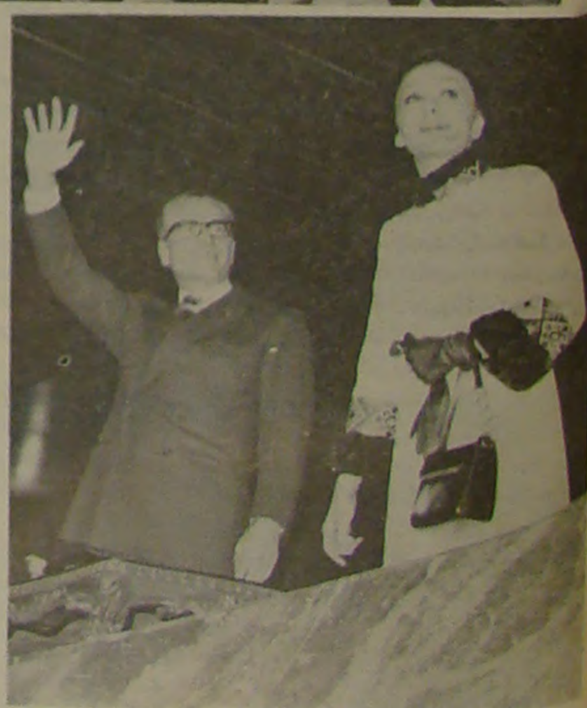
دیروز شاهنشاه و شهبانو با برز احساسات عمیق و شورانگیز هزاران نفر از تشریف کنگره ملی، بزرگداشت انقلاب پاسخ دادند

● دانشنامه، پاهر و علیاحضرت شهبان و بعد از ظهر دیروز با حضور در اجلاس کنگره بزرگ ملی ایران این کنگره را شرق در غرور و مباحثات کردند در این اجلاس آقایان امیر عباس هویدا نخست وزیر رئیس هیئت مدیره شرکت ملی نفت ایران و رئیس دفتر مختصر شاهنشاه، شهردار تهران، سناتورها و نمایندگان مجلس و رؤسای هیئت های نمایندگان سیاسی خادمان مقام در بار شاهنشاهی، عده ای از شخصیت های دولتی و ملی حضور داشتند بهنگام نزول اجلاس اعلیحضرتین به محل کنگره، شاهنشاه و علیاحضرت شهبانو از طرف دانش آموزان در حالی که دسته گل های بدست داشتند مورد استقبال پر شور قرار گرفتند در ساختمان کاخ ورزش یک دختر به نام جمشید از فرمانیات شاهنشاه را بنام «سمن شاه» به پیشگاه شاهنشاه تقدیم کرد. اعلیحضرتین در میان پر شورترین احساسات شرکت کنندگان در کنگره در جایگاه مخصوص نزول اجلاس کردند رئیس کنگره طی سخنانی مقدمه اعلیحضرتین را گرامی داشت و گفت، اعضای کنگره از این موقعیت پیروید میبایند تقدیم لوحه سپاس به پیشگاه شهبانویی رئیس کنگره پس از پایان عرایش خود به پیشگاه شاهنشاه بار یافته و لوحه سپاس مردم را تقدیم نمود