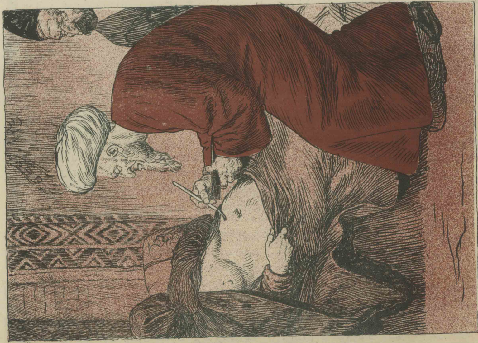
— قوی ملا کو کیمی یازسون، بونک ضرری بوخدی.