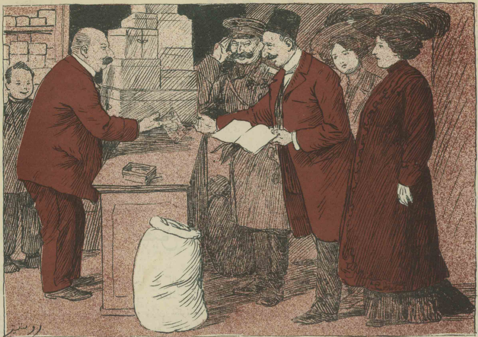
Сборъ пожертвованій для мусульм. благотворит. общества въ Тифлиси.