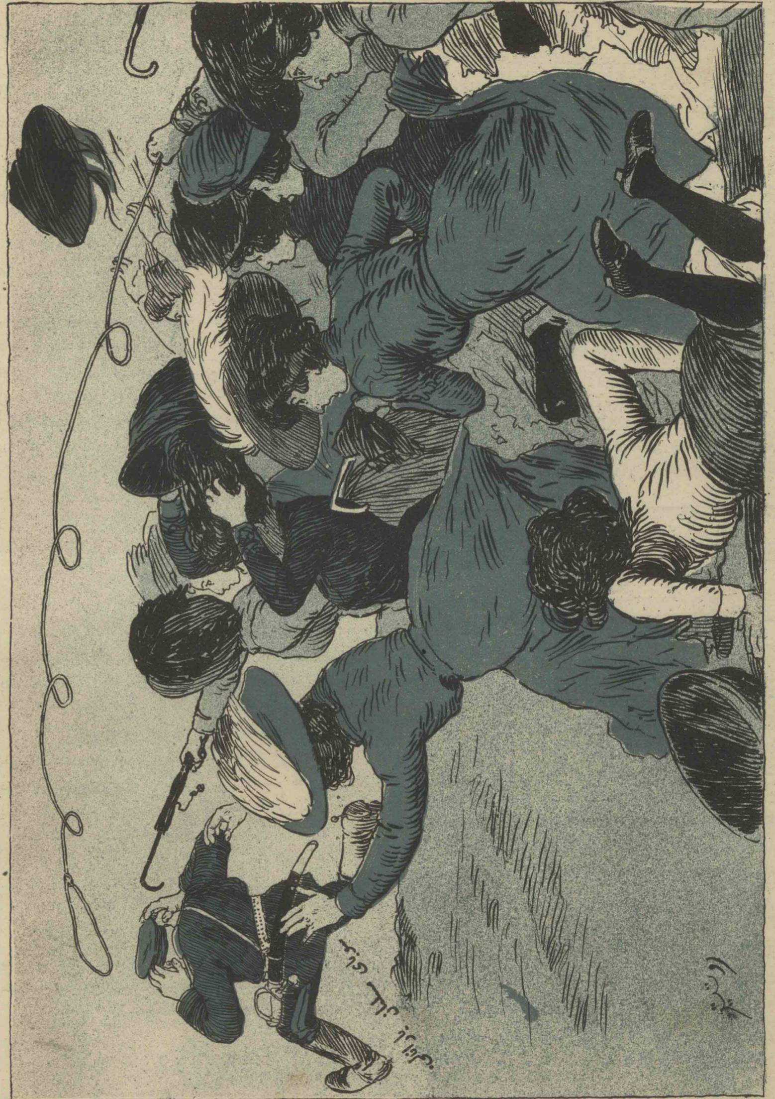
Барщины и вдовушки. Соблазнительный женихъ. (изъ мусульманской жизни) Тифлисъ.