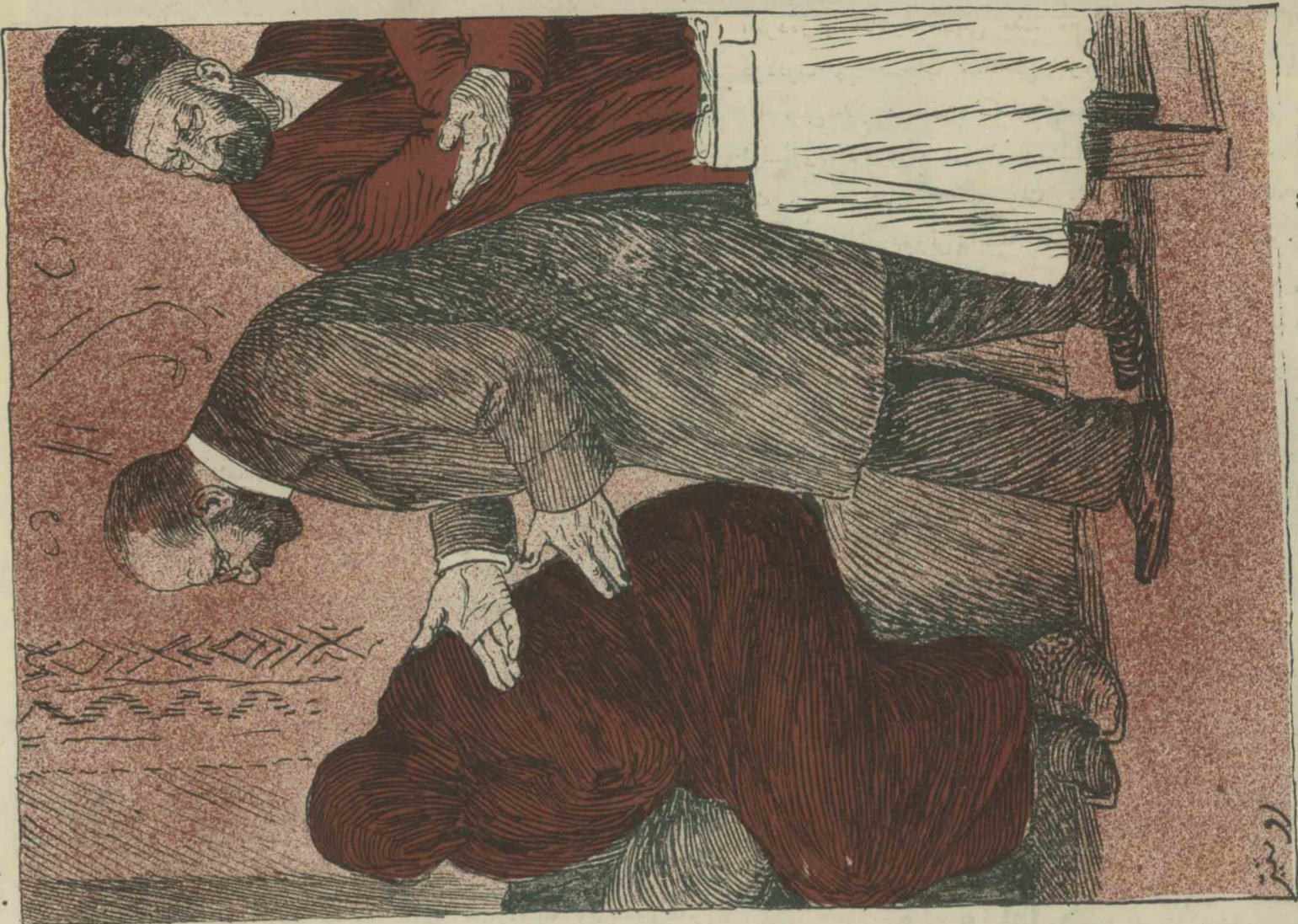
Мужик; открой лицо: доктору должно посмотреть, тебѣ горло. — Нѣтъ, лѣтъ, ни за что не открою. — Ай ароват, ая аозикки, киким богазка пахсон — Юух, юух, аолсем-де ачанам.