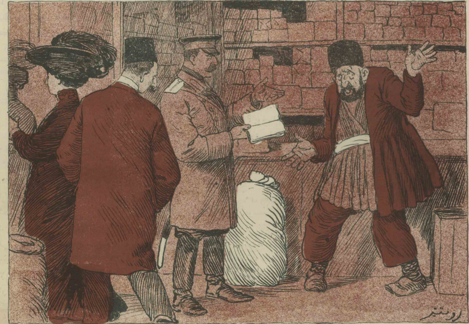
مسلمان خیریت کورنایک.