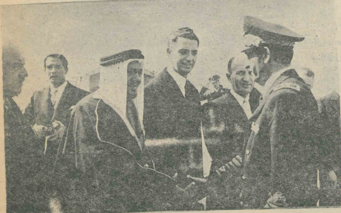
شاهنشاه در فرودگاه مهر آباد به آقای حمزه غوث سفیر کبیر عربستان سعودی در ایران ابراز تقدیر می فرمایند