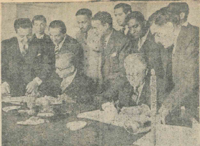
ظهر ۴ شنبه قرارداد مودت ایران و هند در کاخ وزارت امور خارجه امضا شد . در این مجلس آقایان دکتر اردلان کلیل وزارت امور خارجه و سید علی ظهیر سفیر کبیر هند در ایران هنگام امضای قرارداد دیده میشوند .

هیئت وزیران در جلسه بیست و چهارم اسفند ماه بنا به پیشنهاد وزارت کشور و استفاده از تبصره ماده ۲ قانون تقیسات کشور تصویب نمودند که بخش حومه نیشابور از دهستانهای مازول بوند در قاضی تشکیل گردد و انجام امور آن بعهده فرمانداری است و احتیاج با اعتبار علیحده ندارد و دهستان و بلیک اردبیل که دارای ۶۵ پارچه و هات است تبدیل ببخش گردیده و مرکز آن قصبه بخش نین و بخش مریوز بنام بخش نین و تابع شهرستان اردبیل باشد تشکر از فرمانده پانگان مربون - ۲۳ اسفند سرکار سرگرد چمن آراء فرمانده پانگان مریوز با جدیت فوق العاده وقت خود را صرف تهیه وسایل آسایش اهالی مینمایند . سرمد انتظار دارند ستاد ارتش از خدمات چنین افسر لایقی قدردانی نماید