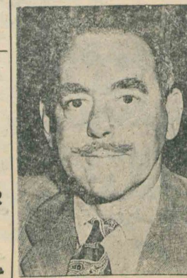
آچسن خبرهای ورزشی را در صفحه ۷ و ۴ بخوانید

پاریس - وزارت خارجه فرانسه دیروز اعلام کرد که ازدادن گذرنامه به ایلیا اهرنبرگ روزنامه نگار شوروی خودداری کرده زیرا معتقد است که فعالیت های او میکسست مضربعال کشور فرانسه باشد. اهرنبرگ که از روزنامه نگاران و نویسندگان بنام شوروی است ظاهرا می خواسته برای هر کت در کنفرانس سازمان بین المللی روزنامه نگاران که در تاریخ بیست و هفتم مارس در پاریس تشکیل میشود بفرانسه برود. سخنگوی وزارت خارجه فرانسه اظهار داشت که از ورود اهرنبرگ ازینجهت که کونیست است جلوگیری شده بلکه دولت فرانسه احتمال میدهد که فعالیت های شخصی او اشکالاتی برای دولت فراهم نماید.