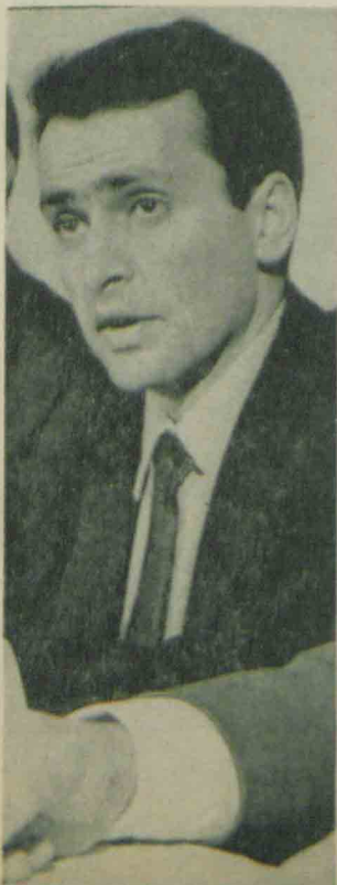
شرح عکسها: سلطان قابوس نیکخواه حسن زاهدی