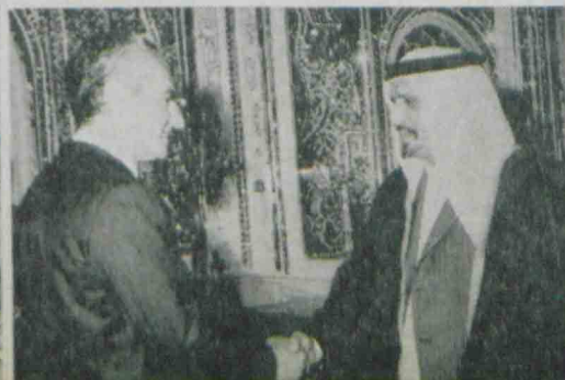
عکس‌ها بترتیب : حاکم قطر در حضور شاهنشاه پرنس سیهانوک زین‌العابدین احمد مکی اسمیت دوبچک علی‌آبادی نصری