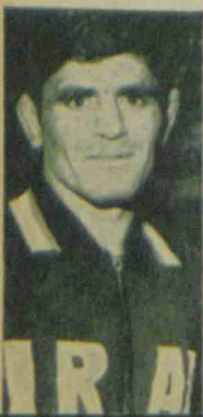
ملا مصطفی بارزانی سیدعباسی سوکارنو جیلو آندرونوتی علی آبادی

* طی چند حادثه در آنکارا، کره، نیویورک و شیکاگو ۱۵۹ نفر کشته و مجروح شدند. * اعلام شد، یک پل بزرگ روی زاینده رود اصفهان ساخته می شود. احداث پل جدید را انجمن شهر اصفهان تصویب کرد. ۲۹ تیر * قبله کاخ مرمر تسلیم شهردار تهران شد. * بحاکم شارجه سوء قصد شد. * فرانسه به لبنان رادار داد. * برق ۲۰۰۰ کیلو واتی قریه زارچ یزد افتتاح شد. ۳۰ تیر * کشور های آفریقائی انگلستان را تحریم کردند. * کارگران کشور های اروپائی به هواداری از بار اندازان انگلیس اعتصاب کردند. * کمک عربستان بدول عربی قطع شد. * سد انحرافی سد ارس افتتاح شد. * سینما «ری» تهران در یک آتش سوزی مدهش سوخت. ۳۱ تیر * لیبی اموال ۲۵ هزار یهودی و ایتالیائی را مصادره کرد. * اختیار جدیدی باستانداران و فرمانداران کل تفویض شد. * چریکها یک هواپیمای مسافری یونان را ربودند. * ۶۵ ثانیه رکورد شنای ۴×۲۰۰ متر امدادی کشور در یک رکوردگیری رسمی شکسته شد. * در تهران و مشهد ۲ قاچاقچی