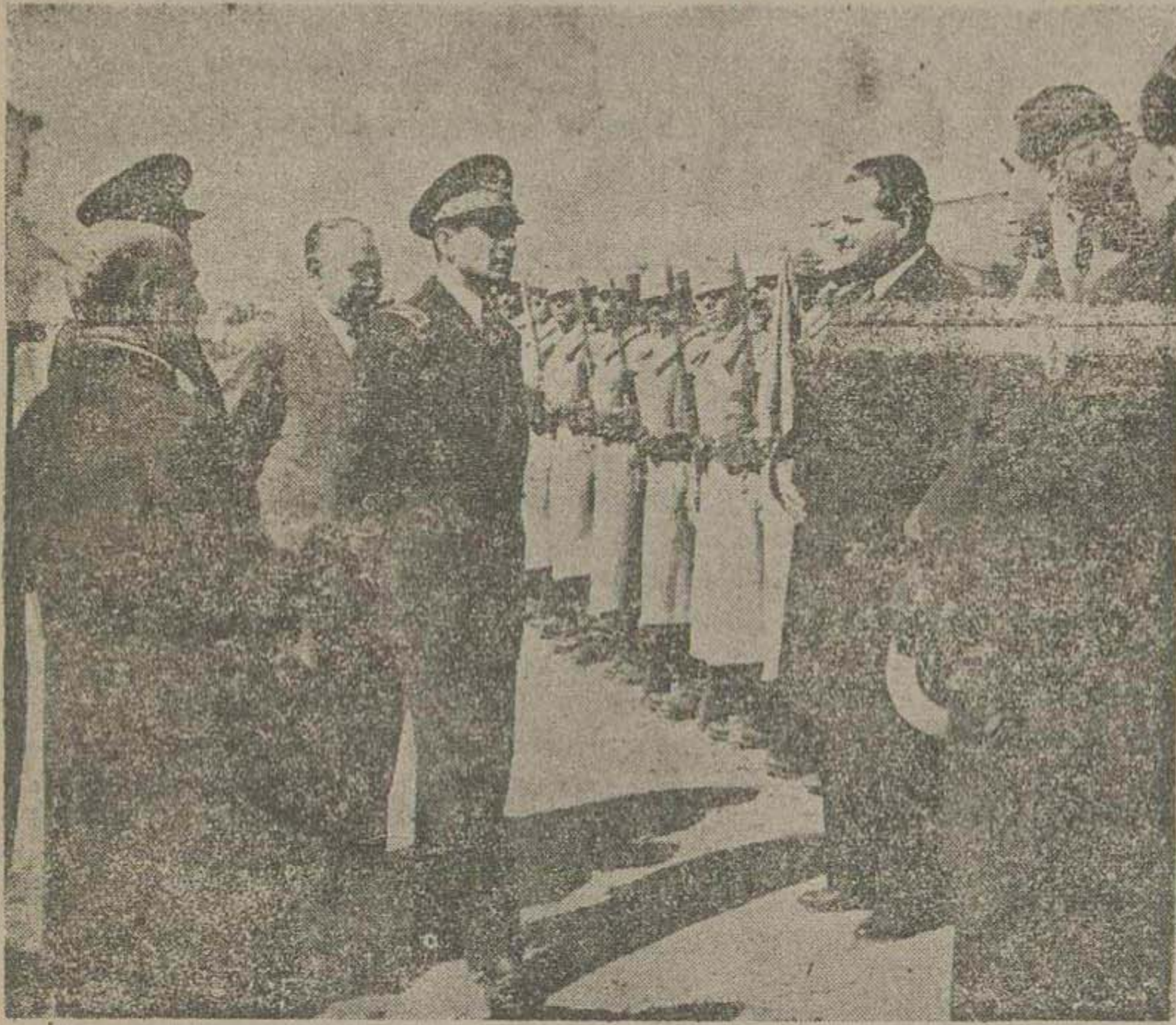
آقای جم وزیر دربار - آقای سبیلی وزیر مشاور - آقای دکتر اقبال - آقای بدر نایب التولیه آستان قدس رضوی و آقایان نمایندگان خراسان در نرود گاه مشهد شرفیاب حضور ملوکانه میباشد.