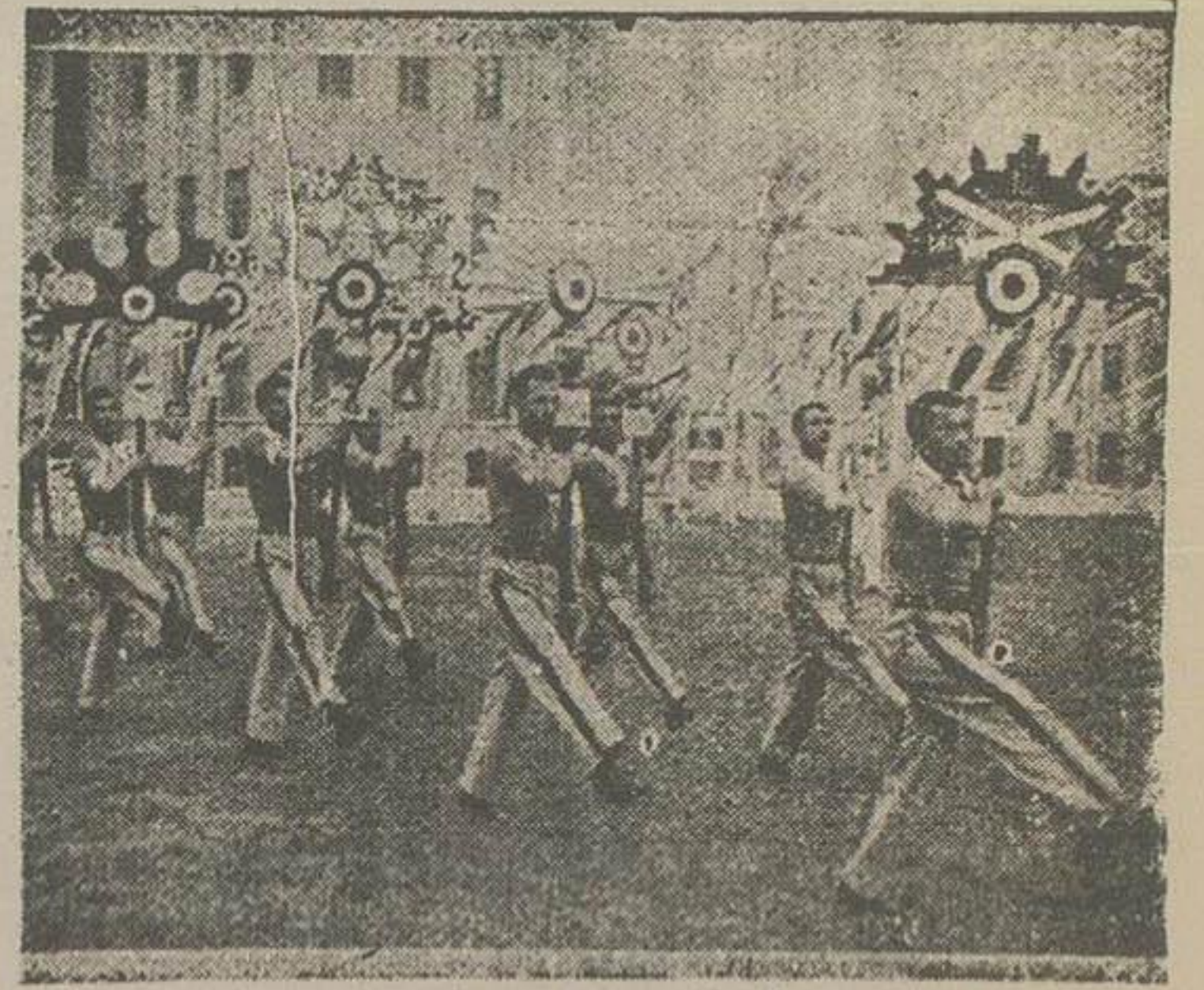
ورزشکاران دانشکده افسری با پرچمهای مخصوص از برابر اعلی حضرت هماهنگی میروند