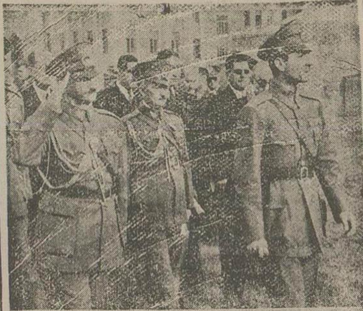
ایشان حضرت همایون شاهنشاهی در حالیکه آقایان وزیران در الزام میباشد زمین ورزش دانشکده افسری را بازدید میفرمایند