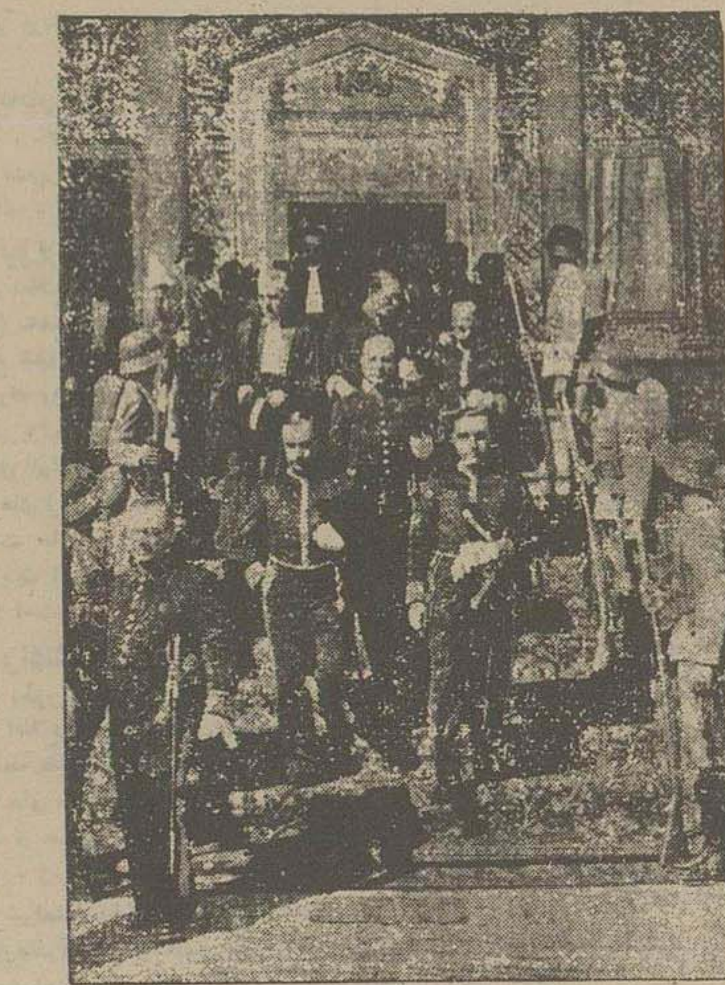
کارمندان ادارةها و رؤسای عالی رتبه وزارتخانه ها در مراجعت از شرفیابی

سالون ها با چراغهای رنگارنگ و کادان های گل مزین و آراسته شده بود در تمام مدت از کستر با نوا های دلنبر مترنم و در هریک از کافه ها بترتیب خاصی از واردین