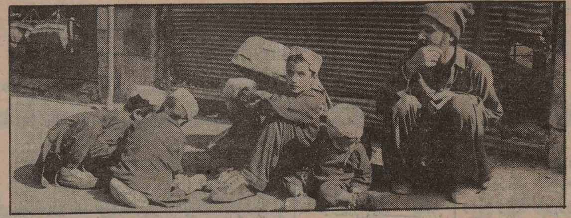
به مناسبت برگزاری مجمع بررسی مسائل جوان و نوجوان - ع

متوسط قامت است با گونه‌های ظریف و کرمی که به نرمی بر صورتش روئیده، به زحمت ۱۷ ساله به نظر می‌رسد یک سلوار جین و پیراهن اسپرت در بر کرده و با کفش ورزشی که به پا دارد در حاشیه سایه‌دار پیاده‌رو بالا و پایین می‌رود. دستهای بیادکنک، به رنگهای درخشان، قرمز و سبز و آبی و ... در دستهای عرق کرده‌اش با ورزش نرگه بسادی تکان می‌خورد. دور و برش چند