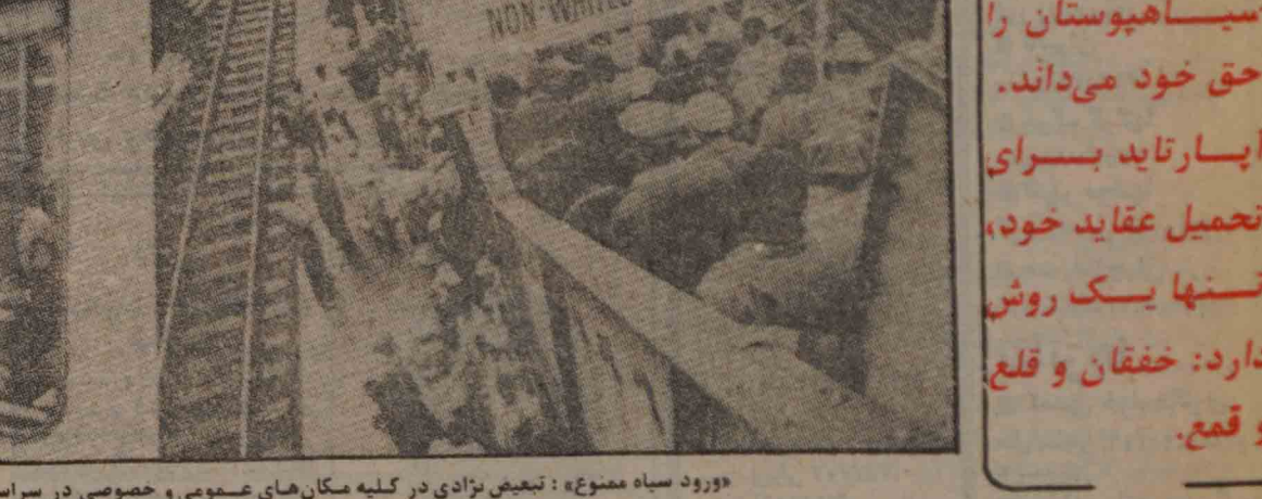
«دور رسیده مسموع»: تبعیض نژادی در کلیه مکان‌های عمومی و خصوصی در سراسر آفریقای جنوبی مشاهده می‌شود.

در آفریقای جنوبی آپارتاید اقلیتی است که قدرت را در گنجله‌های خود گرفته، حیوانات را در سیاهپوستان تسخیر می‌دهد. اقلیتی که خود را تافته جدا تافته از دیگر مخلوقات خدا