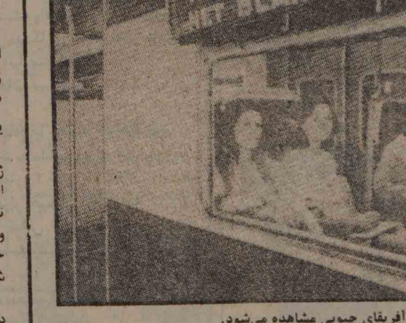
«دور رسیده مسموع»: تبعیض نژادی در کلیه مکان‌های عمومی و خصوصی در سراسر آفریقای جنوبی مشاهده می‌شود.

آپارتاید اینجاست، حضور دارد تا قوانین خود را به صورت ممکن تحمیل کند. آپارتاید اینجاست، حضور دارد و برای نیل به این هدف و چیزی بر مردم، تنها یک روش وجود دارد: خفقان