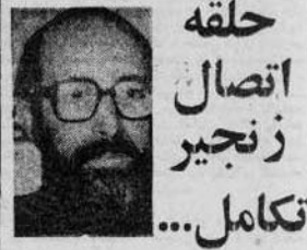
دکتر مصطفی چمران