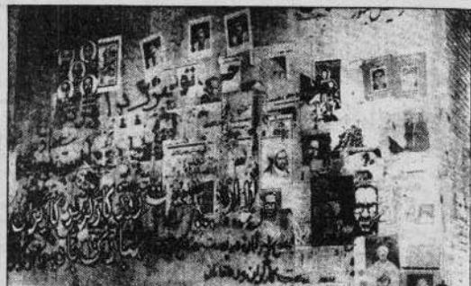
دو راهی شهردار جای عالی ندارد، اعلامیه روی اعلامیه، پوسپر روی پوسپر و شعارهای رنگ و روغن روی همه آنها چنین است که دو راهی شهر به آفتاب نشانیان خرابیهای مختلف انجمنها و فعالیت سیاسی تبدیل شده است